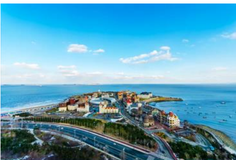
ท่าเรือชาวประมงไห่ซาง