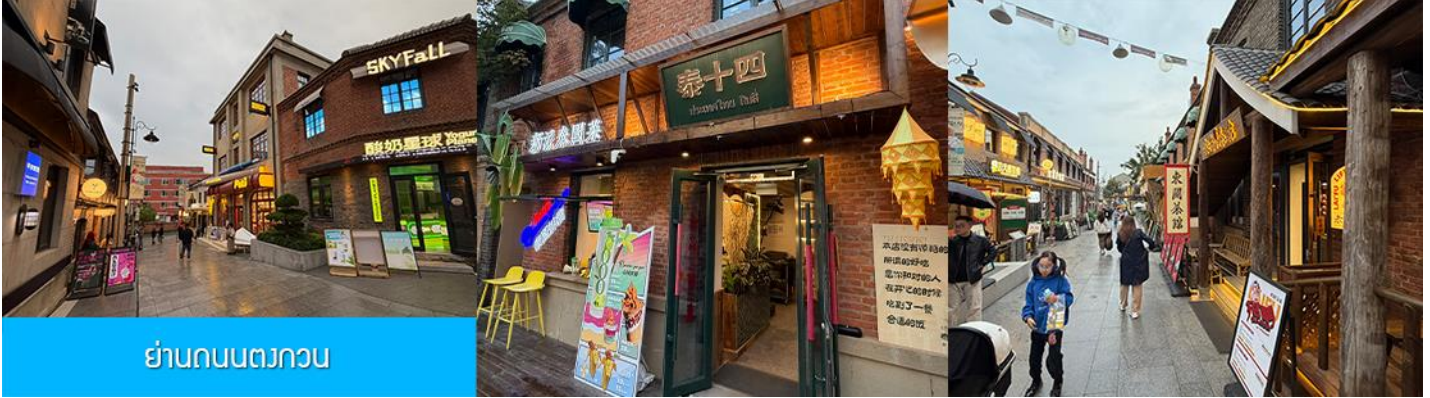
ย่านถนนตวงกวน