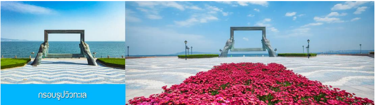
กรอบรูปวิวทะเล

นำท่านชม สวนสาธารณะเว่ยไห่ 威海公园 สวนสาธารณะริมทะเลที่ใหญ่ที่สุดของเมืองเว่ยไห่ ให้ท่านชมและถ่ายภาพคู่กับ กรอบรูปยักษ์วิวทะเล 威海公园大相框 แลนด์มาร์คที่เป็นอีกหนึ่งไฮท์ไลท์สุดฮิตของเว่ยไห่