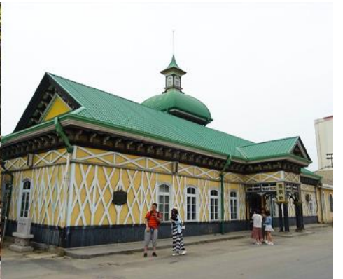
สถานีรถไฟหลี่ชุ่น