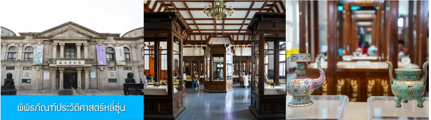
พิพิธภัณฑ์ประวัติศาสตร์ลี่ซุ่น

นำท่านเที่ยวชมและเก็บภาพ ณ สถานีรถไฟลี่ซุ่น 旅顺火车站 เป็นสถานีปลายทางของเส้นทางรถไฟสาขา เส้นหยาง - ต้าเหลียน สร้างขึ้นในปีค.ศ. 1903 ออกแบบโดยสถาปนิกชาวรัสเซีย เป็นอาคารอิฐก่อปูนผสม โครงสร้างไม้ตามสถาปัตยกรรมรัสเซีย.