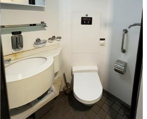
เรือ ZHONGTIE BOHAI CRUISE

เมื่อเวลาแก่เวลา นำท่านขึ้นเรือ ZHONGTIE BOHAI CRUISE เพื่อเดินทางสู่เมืองต้าเหลียน 22.00 น. เดินทางโดยเรือท่องเที่ยว ZHONGTIE BOHAI CRUISE เพื่อเดินทางสู่เมืองต้าเหลียน คืนนี้พักบนเรือห้องละ 2 ท่าน *(ห้องพักปรับอากาศแบบ 4 เตียง)*