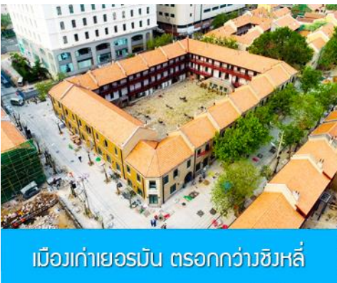
เมืองเก่าเยอรมัน ตรอกกว้างซิงหลี่

จากนั้นนำท่านเดินเที่ยวชม ถนนจงซาน 中山路 ถนนที่เต็มไปด้วยกลิ่นอายยุโรป และถนนสายนี้มีบันทึกเรื่องราวมากกว่าศตวรรษของเมืองชิงเต่าไว้ ที่นี่เป็นศูนย์กลางการค้าแห่งแรกที่เต็มไปด้วยสถาปัตยกรรมสไตล์ยุโรปเก่าแก่ที่ได้รับอิทธิพลมาจากเยอรมัน ให้ท่านได้เดินเก็บบรรยากาศ และ เก็บภาพกับ โบสถ์เซนต์ไมเกล (ด้านนอก) โบสถ์แห่งนี้ที่คู่รักนิยมมาถ่ายภาพงานแต่งงานกันมากที่สุดในเมืองชิงเต่า ให้ท่านถ่ายรูปเก็บภาพ