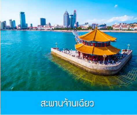
สะพานจ้านเจียว