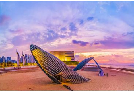
ประติมากรรม วาฬโดดเดี่ยว

จากนั้นนำท่านเดินทางสู่ เมืองเยียนไถ 烟台 (ระยะทาง 72 กม. ใช้เวลาเดินทางราว 1 ชั่วโมง)