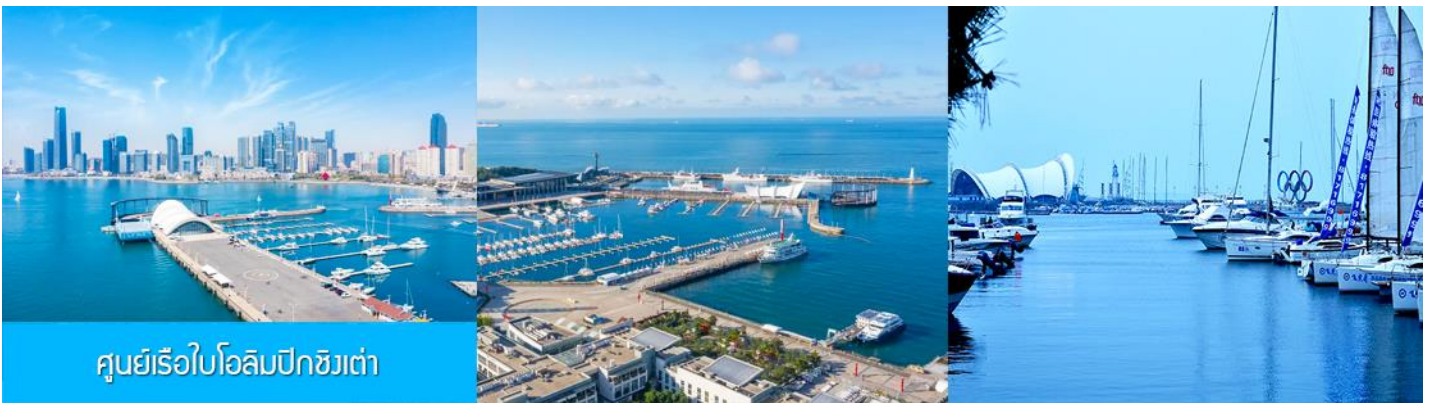
ศูนย์เรือใบโอลิมปิกชิงเต่า

จากนั้นนำท่านเที่ยวชม โรงเบียร์ชิงเต่า 青岛啤酒博物馆 พิพิธภัณฑ์เบียร์ที่ขึ้นชื่อของเมืองชิงเต่า ซึ่งเป็นเบียร์ยี่ห้อแรกที่ผลิตขึ้นในประเทศจีน ชมเบียร์ คอลเลกชันที่มียี่ห้อหลากหลายที่สุดของโลก และชมการจัดแสดงภาพและวิดิทัศน์เกี่ยวกับวิวัฒนาการของเบียร์ ขั้นตอนการผลิตและอื่น ๆ ที่เกี่ยวข้อง พร้อมชิมเบียร์ชิงเต่า ซึ่งเป็นเบียร์ที่ขายดีที่สุดในยี่ห้อหนึ่งของจีน.. (ชิมเบียร์ชิงเต่าท่านละ 1 แก้ว รับกลับอีก 1 ขวดเล็ก ตอนเดินออก)