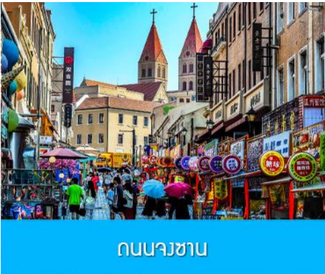
ถนนนางซาน

หลังอาหารนำท่านเดินทางชม สะพานจ้านเจียว 栈桥 เป็นแลนด์มาร์คแห่งประวัติศาสตร์คู่เมืองชิงเต่า สร้างเมื่อปี ค.ศ.1891 มีลักษณะเป็นสะพานหินทอดยาวกว่า 440 เมตรสู่ทะเล ปลายสะพานมีศาลา ทรงแปดเหลี่ยมสีแดงที่โดดเด่น ซึ่งเป็นสัญลักษณ์บนฉลากเบียร์ชิงเต่า ขึ้นชื่อเรื่องวิวสวย รับลมทะเล ให้ท่านเก็บภาพบรรยากาศ