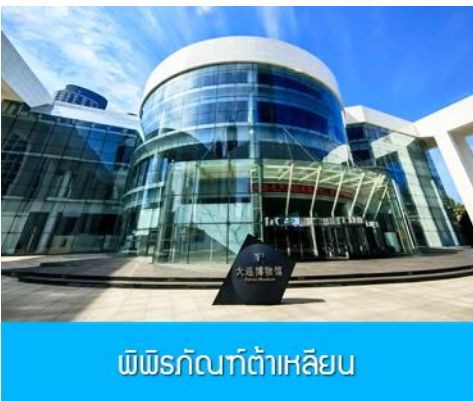
พิพิธภัณฑ์ต้าเหลียน

รับประทานอาหารเช้า ณ ห้องอาหารของโรงแรม (13)