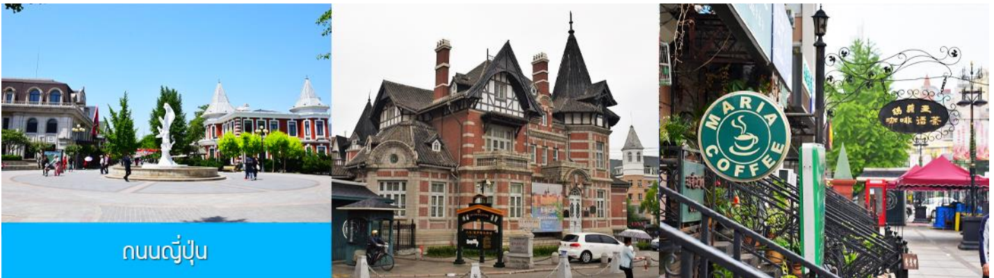
ถนนญี่ปุ่น