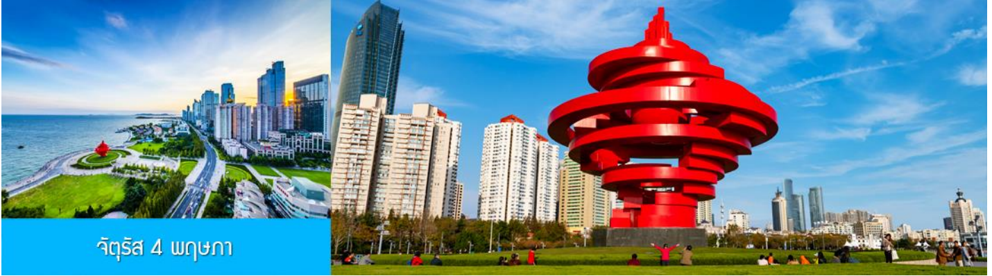
จัตุรัส 4 พฤษภาคม

จากนั้นนำท่านเดินเที่ยวชม จัตุรัส 4 พฤษภาคม May Fourth Square แลนด์มาร์กสำคัญริม อ่าวของเมืองชิงเต่า สถานที่แห่งนี้เป็นจุดที่ชาวเมืองออกมาเดินขบวนเรียกร้องอิสรภาพจากการปกครองของเยอรมัน เมื่อวันที่ 4 พฤษภาคม ค.ศ. 1919 หลังจากตกอยู่ภายใต้การปกครองมานานกว่า 10 ปี ปัจจุบันจัตุรัสแห่งนี้กลายเป็นพื้นที่พักผ่อนยอดนิยมของชาวเมืองและนักท่องเที่ยว และมีประติมากรรมศิลปะแดงรูปเกลียว “May Wind” ที่สื่อถึงพลังและอุดมการณ์ของประชาชนในวันนั้นอย่างสง่างาม