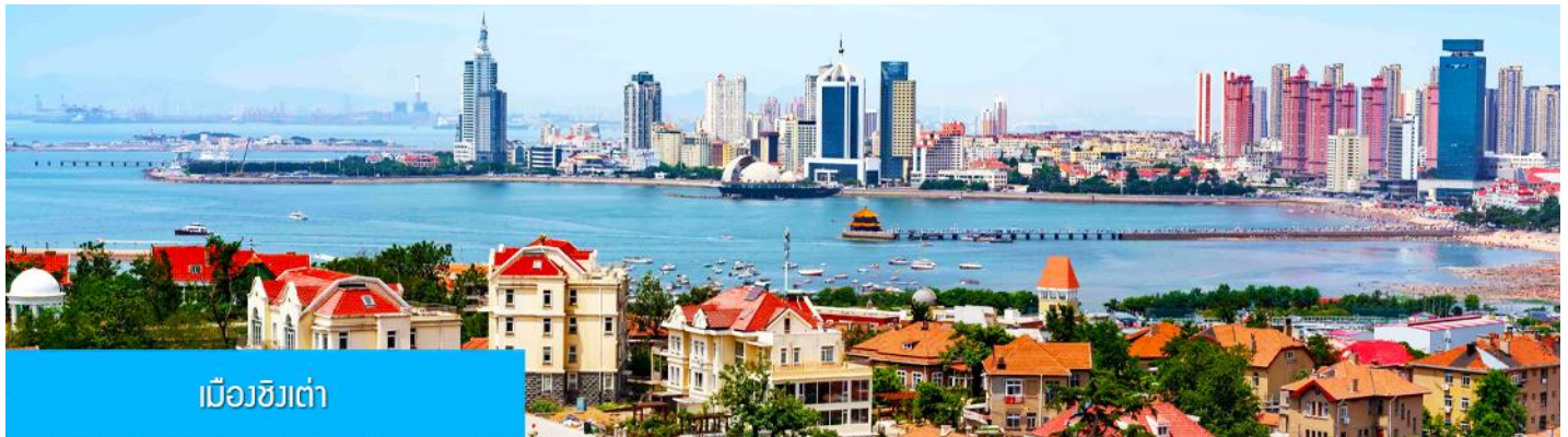
เมืองชิงเต่า