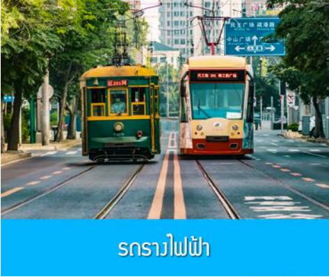
รถรางไฟฟ้า