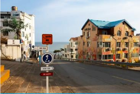
ถนนคอบเพลิงหมายเลข 8