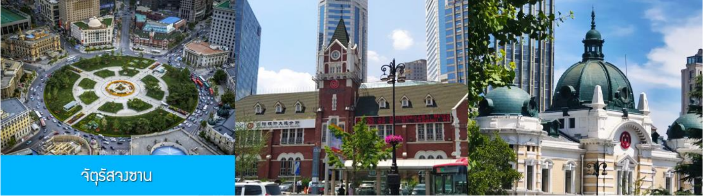
จัตุรัสวงเวียน