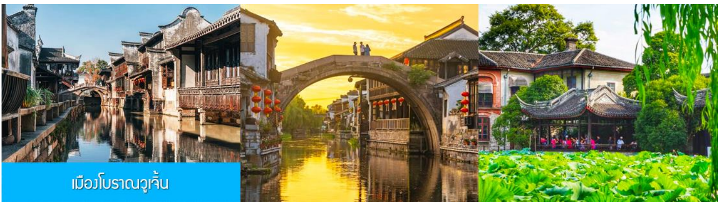
เมืองโบราณวูเจิ้น