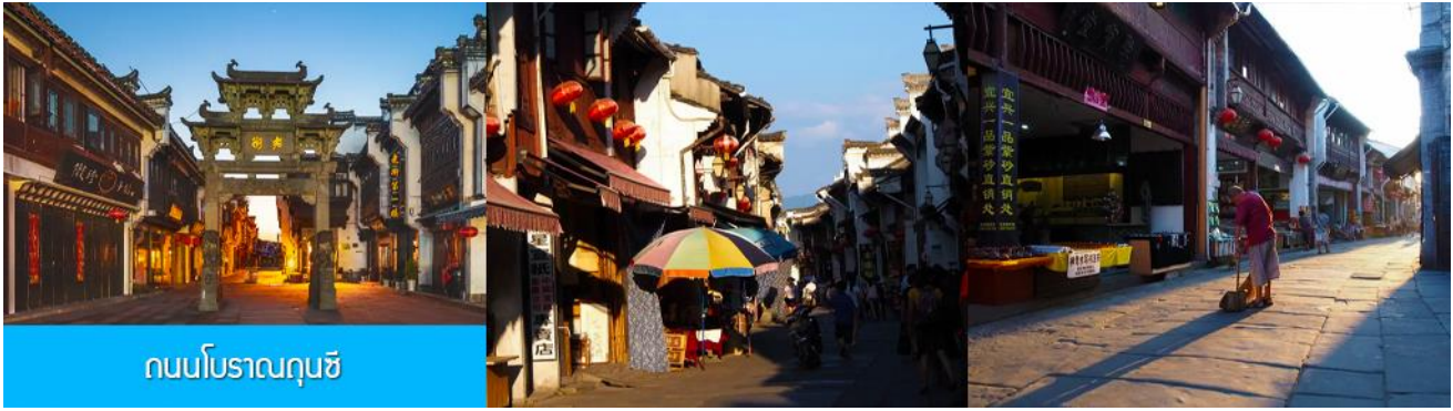
ถนนโบราณถุนซี

นำท่านเที่ยวชม ถนนโบราณถุนซี 屯溪老街 ถนนที่เป็นย่านการค้าโบราณในยุคราชวงศ์ซ่งได้อายุกว่า 700 ปี ถนนมีความยาวราว 1272 เมตร สองฝั่งถนนมีอาคารบ้านเรือนโบราณสไตล์หุยโจวที่สร้างในยุคปลายราชวงศ์หมิงและราชวงศ์ชิงที่ถูกอนุรักษ์ไว้เป็นอย่างดี ปัจจุบันยังมีห้างร้าน โบราณ อาทิ ร้านขายโบราณวัตถุ ร้านขายหยก ร้านขายภาพเขียนและอักษรพู่กันโบราณ ร้านอาหารพื้นเมือง ร้านขายของที่ระลึก ฯลฯ นอกจากนี้ร้านค้าและอาคารบ้านเรือน โบราณที่นี้ยังเป็นแหล่งรวมของนักท่องเที่ยวที่มาชิมอาหารพื้นเมือง เดินช้อปปิ้งและถ่ายภาพ เซ็คอิน