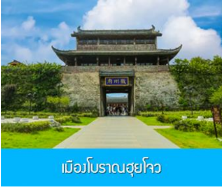
เมืองโบราณฮุยโจว