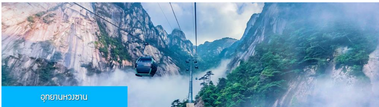
อุทยานหวางซาน