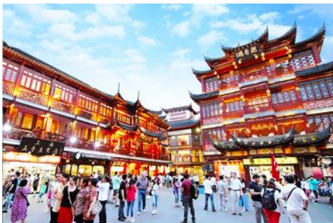
ตลาดเจิงหวงเมี่ยว

รับประทานอาหารเช้า ณ ห้องอาหารของโรงแรม (6)