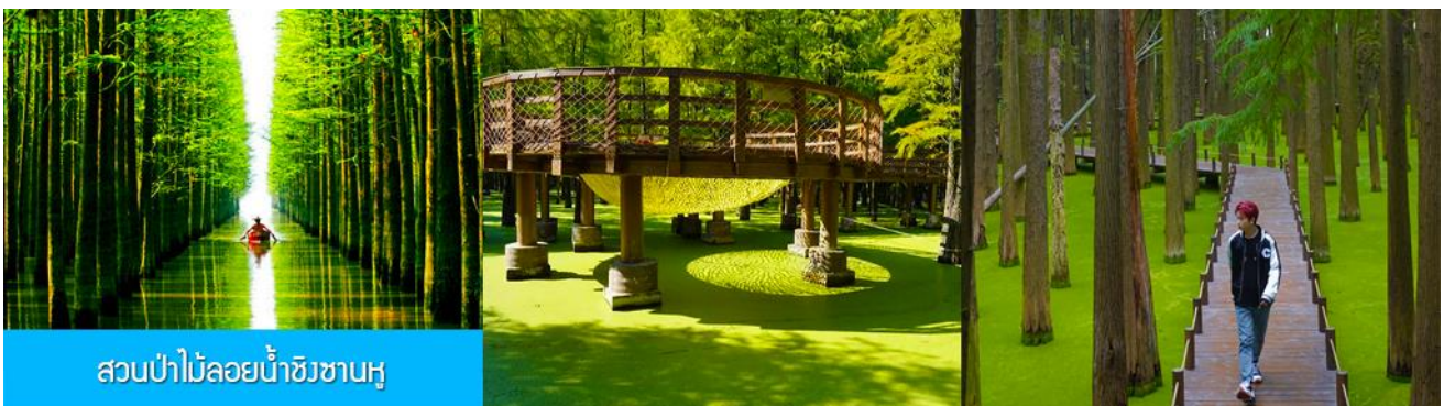
สวนป่าไม้ลอยน้ำชิงชานหู

หลังอาหารเช้าท่านเดินทางโดยรถบัสสู่เมืองหลิงอัน 临安市 (ระยะทาง 175 กม. ใช้เวลาเดินทางราว 2 ชั่วโมงเศษ)