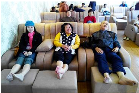
ศูนย์วิจัยแพทย์แผนจีน