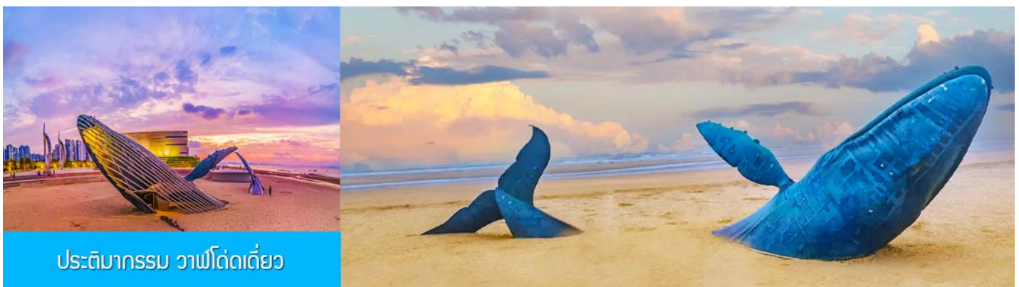
ประติมากรรม วาฬโดดเดี่ยว

จากนั้นนำท่านเดินทางสู่ เมืองเยินไถ 烟台 (ระยะทาง 85 กม.ใช้เวลาเดินทางราว 1 ชั่วโมงเศษ)