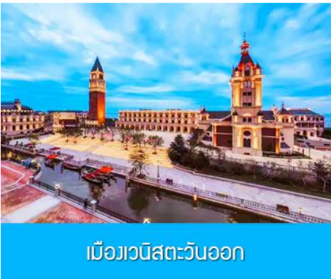
เมืองเวนิสตะวันออก