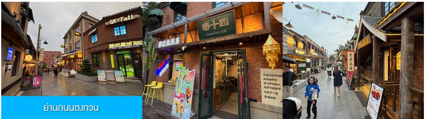
ย่านถนนตงกวน

หลังอาหารนำท่านเที่ยวชม จัตุรัสชิงไห่ 星海广场 เป็นจัตุรัสขนาดใหญ่เป็นแลนด์มาร์คสำคัญของเมืองต้าเหลียน สร้างขึ้นเพื่อเฉลิมฉลองในโอกาสที่รัฐบาลอังกฤษคืนเกาะฮ่องกงในให้จีนในปี ค.ศ. 1997 ตั้งอยู่ชายฝั่งทะเลในเมืองต้าเหลียน เป็นจัตุรัสใจกลางเมืองที่ใหญ่ที่สุดในโลกและเป็นแลนด์มาร์คของเมืองต้าเหลียน รายล้อมด้วยตึกระฟ้าที่ทันสมัย ภายในมีบ่อน้ำพุดนตรี ลานหญ้าขนาดใหญ่ และลานกว้างสำหรับจัดกิจกรรมกลางแจ้ง อาทิ เทศกาลเบียร์นานาชาติ การแข่งขันวิ่งมาราธอน งานแฟชั่นนานาชาติเมืองต้าเหลียน ฯลฯ