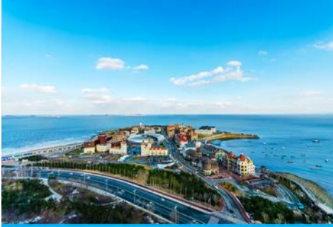
ท่าเรือชาวประมงไห่ซาง