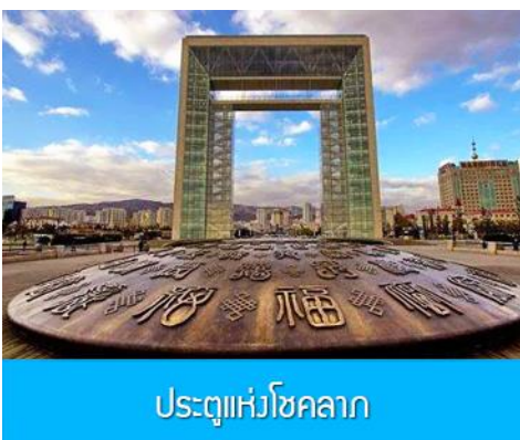
ประตูแห่งโชคลาภ