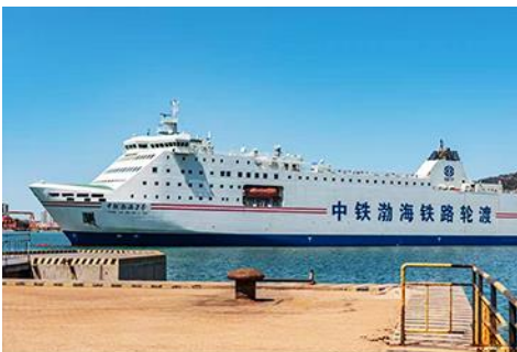
เรือ ZHONGTIE BOHAI CRUISE

เมื่อควาแก่เวลา นำท่านขึ้นเรือ ZHONGTIE BOHAI CRUISE เพื่อเดินทางสู่เมืองต้าเหลียน