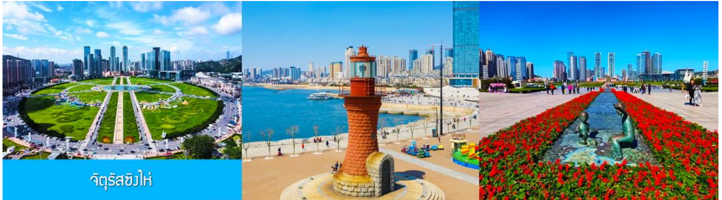
จัตุรัสชิงไห่

รับประทานอาหารเช้า ห้องอาหารของโรงแรม (10)