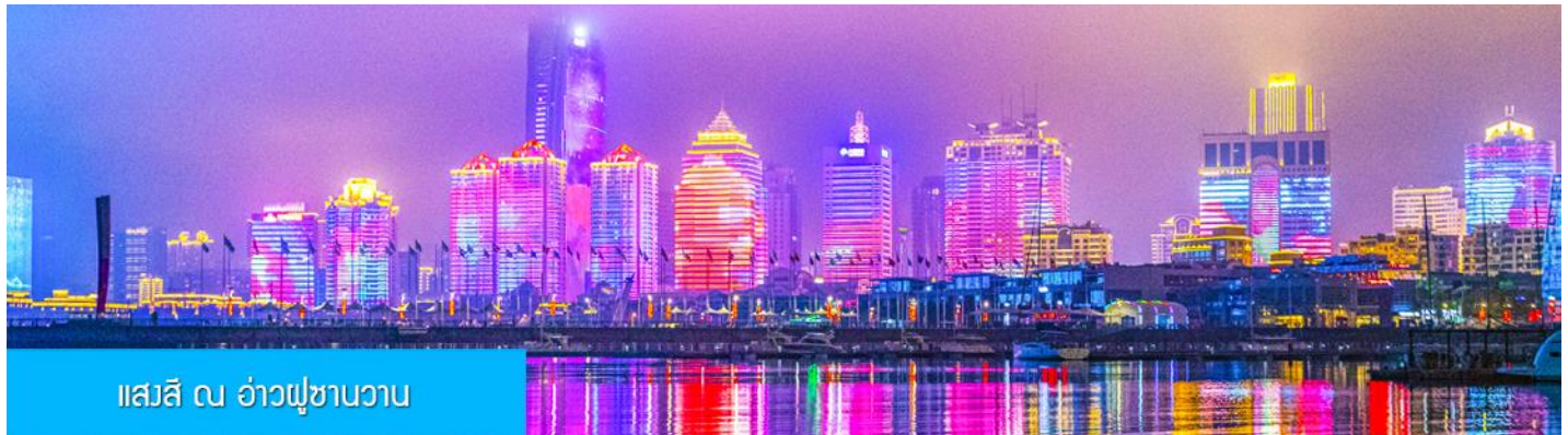
แสงสี ณ อ่าวฝูซานวาน