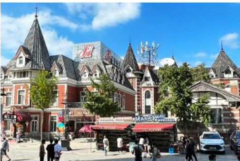
ถนนรัสเซีย

จากนั้นนำท่านขึ้น รถรางไฟฟ้า 有轨电车 เป็นรถรางไฟฟ้าที่สร้างขึ้นในปี ค.ศ. 1909 โดยบริษัทญี่ปุ่น (เมืองต้าเหลียนเคยตกเป็นเมืองขึ้นของญี่ปุ่นในปีค.ศ. 1900 – 1945) นำท่านนั่งรถรางโบราณผ่านชมตัวเมืองต้าเหลียน หนึ่งในเมืองแรก ๆ ที่มีบริการรถรางไฟฟ้าเปิดให้บริการในเขตเมือง ปัจจุบันมีเพียงสายที่ยังเปิดให้บริการในเมืองต้าเหลียน.