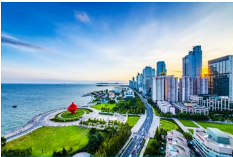
จัตุรัส 4 พฤษภาคม

จากนั้นนำท่านเที่ยวชม โรงเบียร์ชิงเต่า 青岛啤酒博物馆 พิพิธภัณฑ์เบียร์ที่ขึ้นชื่อของเมืองชิงเต่า ซึ่งเป็นเบียร์ยี่ห้อแรกที่ผลิตขึ้นในประเทศจีน ชมเบียร์ คอลเลกชันที่มียี่ห้อหลากหลายที่สุดของโลก และชมการจัดแสดงภาพและวิดิทัศน์เกี่ยวกับวิวัฒนาการของเบียร์ ขั้นตอนการผลิตและอื่น ๆ ที่เกี่ยวข้อง พร้อมชิมเบียร์ชิงเต่า ซึ่งเป็นเบียร์ที่ขายดีที่สุดในยี่ห้อหนึ่งของจีน.. (ชิมเบียร์ชิงเต่าท่านละ 1 แก้ว รับกลับอีก 1 ขวดเล็ก ตอนเดินออก)