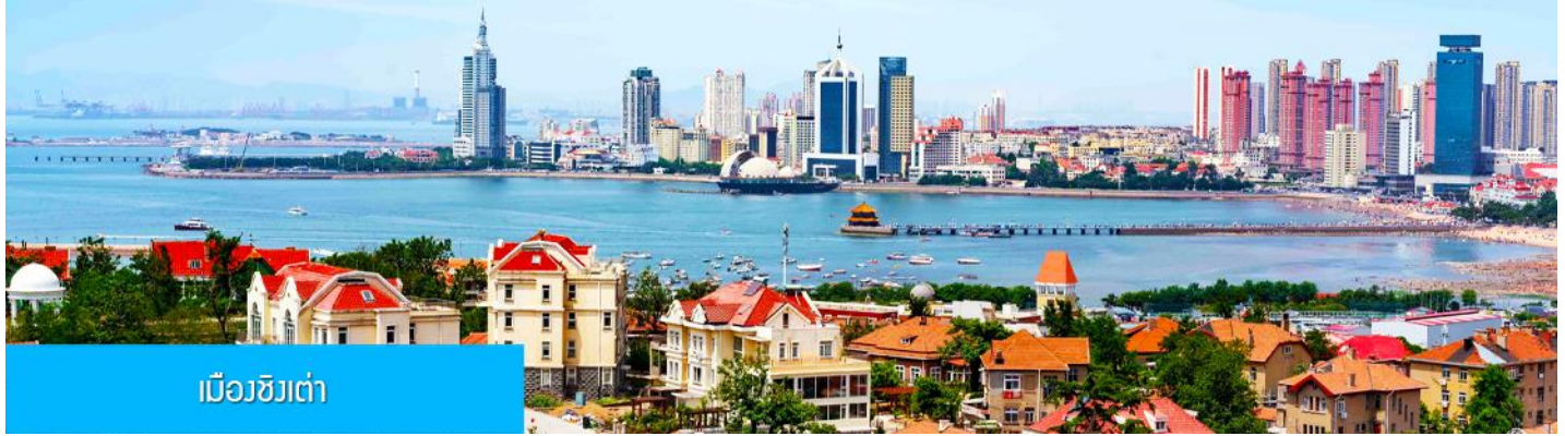
เมืองชิงเต่า