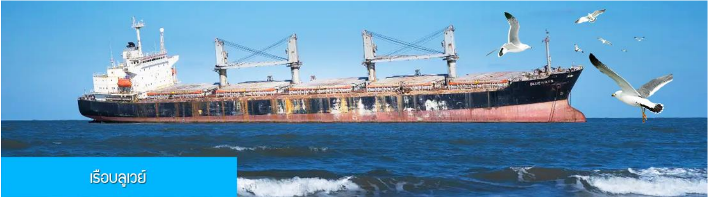
เรือบลูเวย์