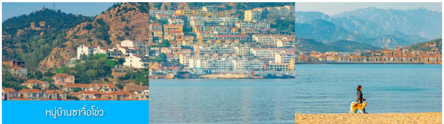
หมู่บ้านซาจื่อโข่ว