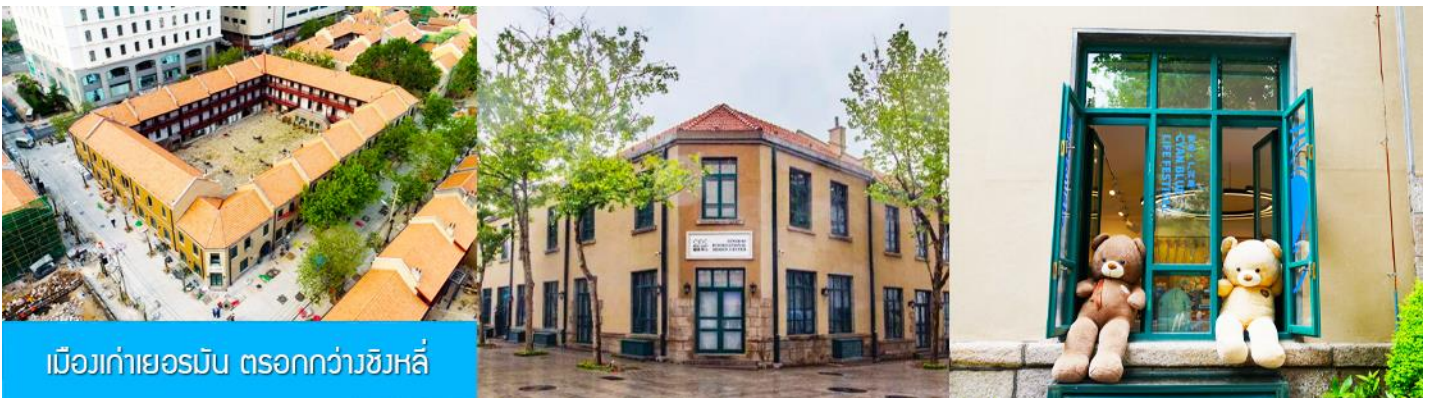
เมืองเก่าเยอรมัน ตรอกกว้างชิงหลี่