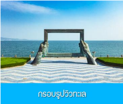
กรอบรูปวิวกทะเล

รับประทานอาหารเช้า ณ ห้องอาหารของโรงแรม (7)