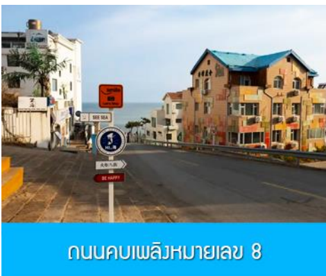
ถนนคอบเพลิงหมายเลข 8

นำท่านชมสวนสาธารณะเวย์ไห่ 威海公园 สวนสาธารณะริมทะเลที่ใหญ่ที่สุดของเมืองเวย์ไห่ ให้ท่านชมและ ถ่ายภาพคู่กับ กรอบรูปยักษ์วิวกทะเล 威海公园大相框 แลนด์มาร์คที่เป็นอีกหนึ่งไฮไลท์ฮิตของเมืองเวย์ไห่