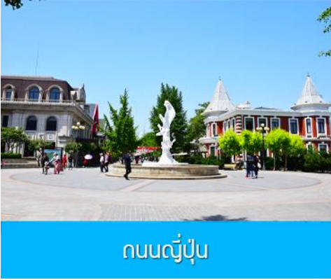
ถนนญี่ปุ่น