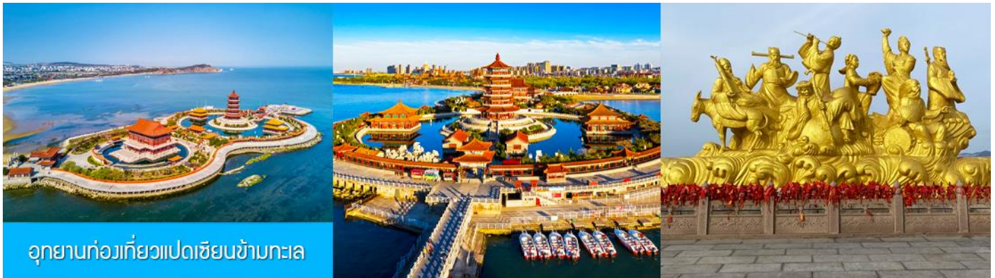
อุทยานท่องเที่ยวแปดเซียนข้ามทะเล