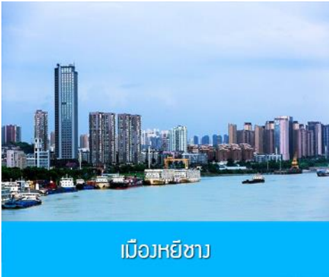
เมืองหยี่ซาง