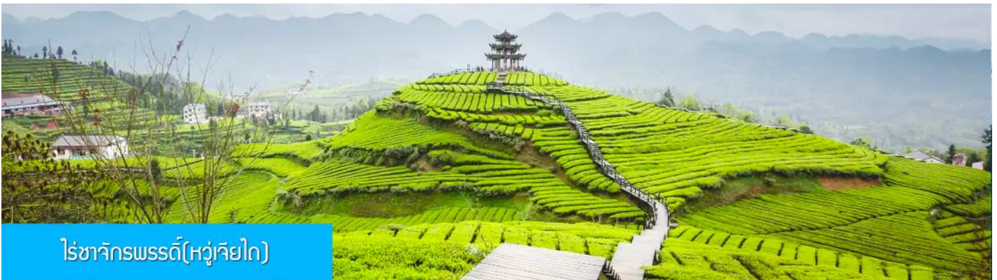
ไร่ชาจักรพรรดิ(หู่เจียไถ)

รับประทานอาหารเช้า ณ ห้องอาหารของโรงแรม (4)