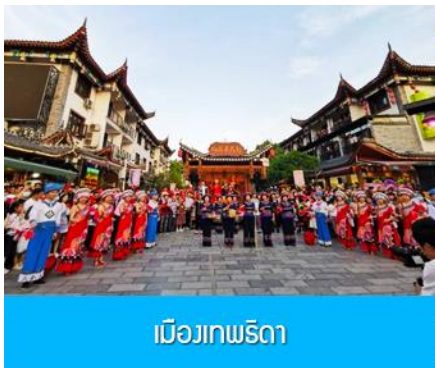
เมืองเทพธิดา

หลังอาหารนำท่านเดินทางโดยรถบัสสู่ เมืองเินซือ 恩施 (ระยะทาง 236 กม. ใช้เวลาเดินทางราวผ่านถนนซูเปอร์ไฮเวย์ประมาณ 3 ชั่วโมง)