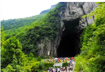
ถ้ำพญามังกร