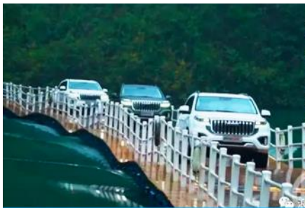
นั่งรถผ่านชมถนนลอยน้ำด่านสิงโต