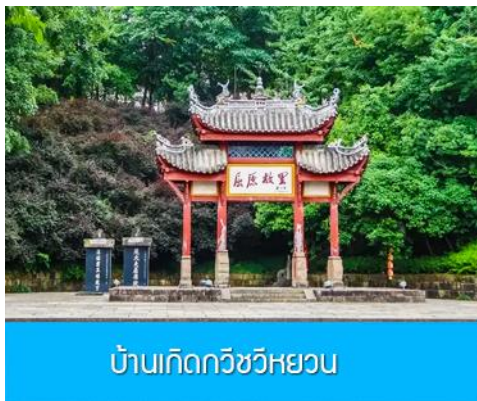
บ้านเกิดกวีชวีหยวน

พักที่ HONGQIAO HOTEL โรงแรมระดับ 4 ดาวหรือเทียบเท่าในเมืองหยีซัง