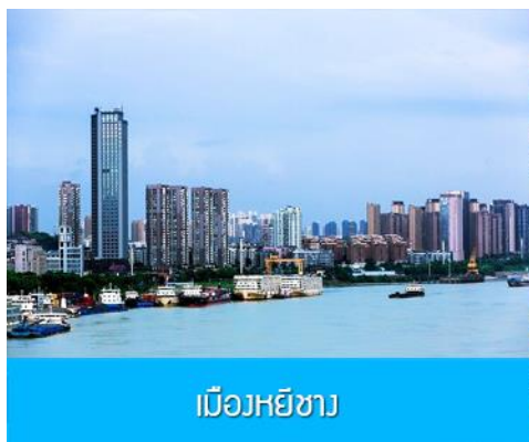
เมืองหยีซาง