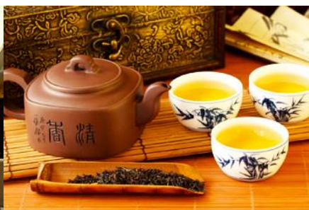
ศูนย์จำหน่ายผลิตภัณฑ์ใบชา