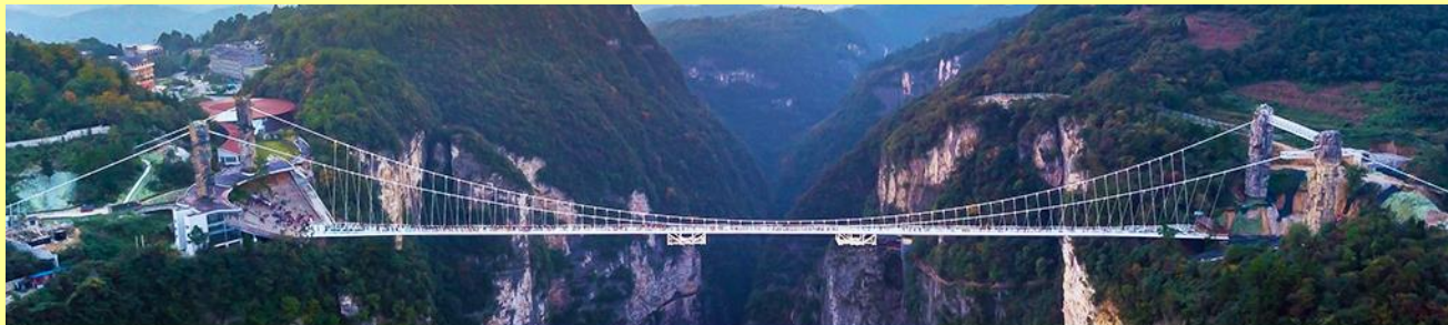
สะพานกระจากข้ามหุบเขาแกรนด์แคนยอน

โปรแกรมเที่ยวชมสะพานกระจากพร้อมหุบเขาแกรนด์แคนยอนจางเจียเจี้ย (ผู้เข้าร่วมขั้นต่ำ 15 ท่าน) ใช้เวลาประมาณ 2-3 ชั่วโมง (ขึ้นอยู่กับจำนวนนักท่องเที่ยวในแต่ละวัน) อัตราค่าบริการท่านละ 400 หยวนหรือ 2,000 บาท นำท่านเที่ยวชมสะพานกระจากที่สร้างครอบหุบเขาที่ยาวที่สุดในโลก ทำทาทความกล้าของท่านด้วยการเดินบนพื้นกระจกใสที่สามารถมองเห็นก้อนเหวลึกที่อยู่เบื้องล่าง....อัตราค่าบริการรวม ค่าบัตรเข้าอุทยาน ค่ารถรับส่งภายในเขตอุทยาน ค่าน้ำที่ขงไกด์ท้องถิ่น