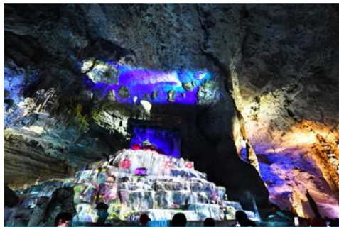
ถ้ำเก้าสวรรค์จิวเทียนต้ง

พักที่ HANTING HOTEL ระดับ 4 ดาวท้องถิ่นหรือเทียบเท่าในเมืองจางเจียเจี๋ย