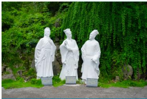
สวนเก้าสามสหาย