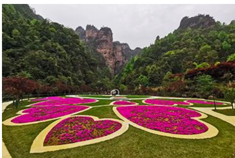
อุทยานฟงเลี่ยนซี