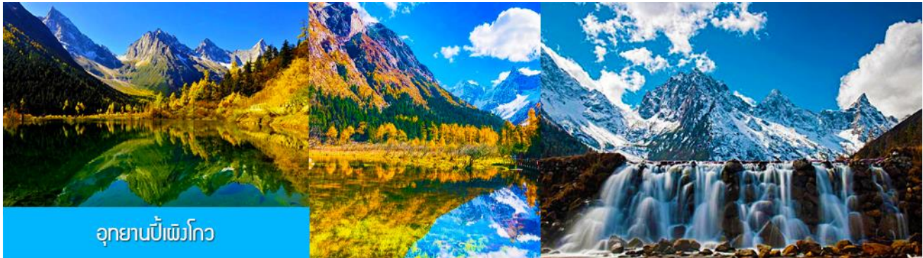
อุทยานปีเผิงโกว