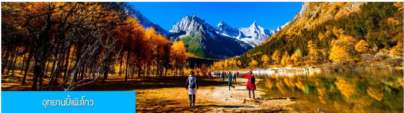
อุทยานบีเพิงโกว