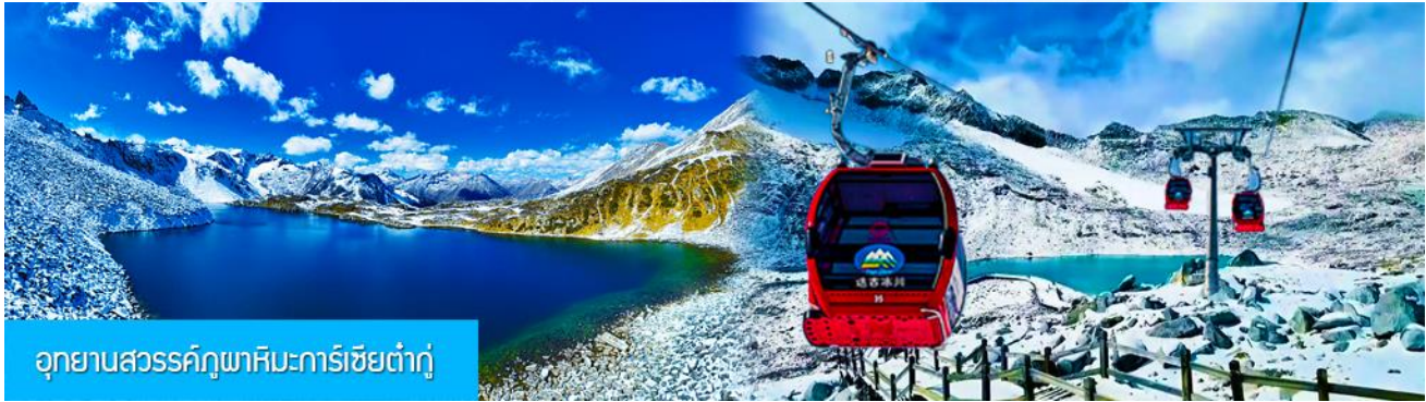
อุทยานสวรรค์ภูผาหิมะการ์เซียต้ากู๋