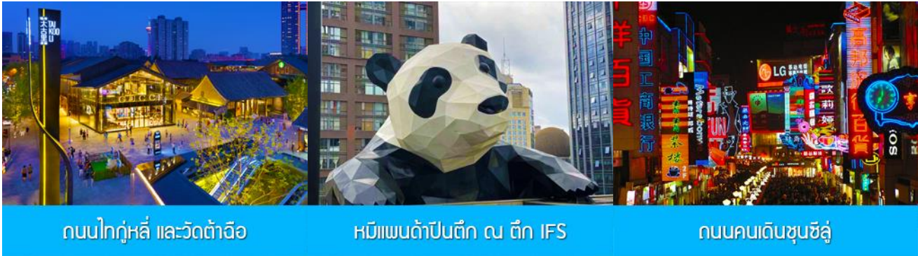
ถนนไท่กู่หลี่ และวัดต้าเจี๋ย