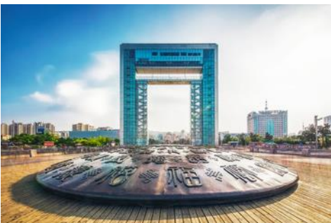
ประตูแห่งโชค

จากนั้น นำท่านเก็บรูปกับ ถนนคอบเพลิงหมายเลข 8 火炬八街 มุมสุดฮิต ที่ต้องมาเก็บรูป เป็นถนนสายเล็ก ๆ ที่ทอดยาวสุดตา เหมือนกับว่าบรรจบกลับเส้นขอบฟ้า เป็นจุดที่นักท่องเที่ยวต้องมาเก็บภาพบรรยากาศ เพราะฮิตที่สุดของเมืองเว่ยไห่แล้วตอนนี้ ให้ท่านได้เก็บภาพ และนั่งชิลคาเฟ่ ตามอัธยาศัย จนได้เวลาอันสมควร นำท่านเดินทางต่อสู่ ประตูแห่งโชค และนี่คือ อีกหนึ่งสัญลักษณ์แห่งเมืองเว่ยไห่ ประตูสู่ความปรารถนา ณ ริมชายฝั่งทะเลของเมืองเว่ยไห่ สัญลักษณ์แห่งความหวัง และความสุขของชาวพื้นเมือง ประตูนี้สร้างขึ้นเพื่อฉลองครบรอบ 100 ปี ของการเปิดท่าเรือเว่ยไห่ จึงขนานนามว่าเป็น ประตูแห่งโชคโลก ที่คอยต้อนรับนักท่องเที่ยวทุกท่าน โครงสร้างของประตูที่ตั้งตระหง่าน โอบล้อมของท้องทะเลและเกาะหลิวกง อยู่เบื้องหน้า เป็นภาพที่สวยงาม ให้ท่านเก็บบรรยากาศเป็นที่ระลึก จากนั้นเดินทางสู่ภัตตาคาร