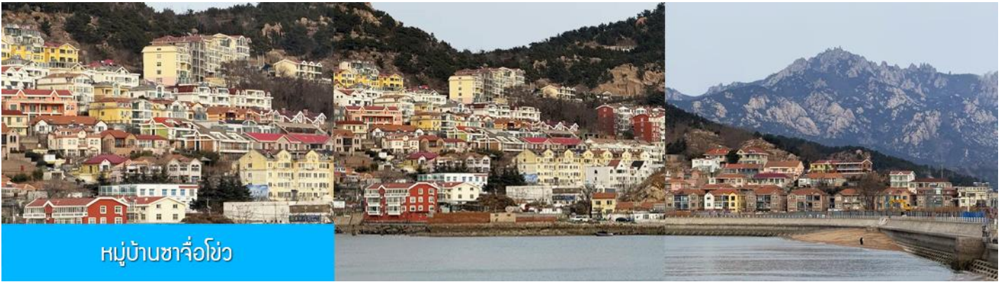
หมู่บ้านชาจื่อโข่ว

จากนั้นนำท่านสัมผัสสมนต์เสน่ห์หมู่บ้านชาวประมง ชาจื่อโข่ว 沙子口渔村 ให้ท่านได้ชมวิถีชีวิตดั้งเดิมกับทิวทัศน์ชายทะเล วิถีบ้านเรือนหลากสีที่ตั้งเรียงรายตามแนวชายฝั่งซึ่งเป็นสัญลักษณ์ ทำให้ หมู่บ้านชาจื่อโข่ว เป็นเอกลักษณ์เป็นจุดถ่ายภาพราวกับเมืองชายฝั่งของอิตาลีในยุโรป, จึงเป็นที่ดึงดูดให้นักท่องเที่ยวต่างอยากมาสัมผัสบรรยากาศ ณ หมู่บ้านชาวประมงชาจื่อโข่วแห่งนี้