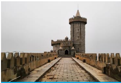
คาเฟ่อีสต