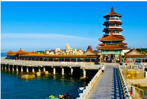
ศาลาพิงไหล

จนได้เวลาอันสมควรนำท่านเดินทางสู่ คฤหาสน์เหวินเจี๋ย 文成城堡 คฤหาสน์สไตล์ยุโรป ที่ตั้งตระหง่านอยู่ริมทะเลในเมืองเยียนไถ ที่นี่ไม่ใช่แค่สถาปัตยกรรม แต่คือ ประตูลูกโลกแห่งจินตนาการที่ท่านจะได้สัมผัสความหรูหรา และได้สัมผัสกับสถาปัตยกรรมสไตล์บารอกที่ยิ่งใหญ่ เหมือน หลุดเข้าไปในเทพนิยายของยุโรป ให้ท่านเก็บภาพบรรยากาศตามอัธยาศัย จนได้เวลาอันสมควร นำท่านเดินทางสู่ภัตตาคาร