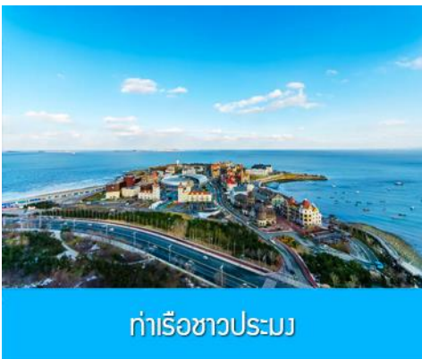
ท่าเรือชาวประมง

08.05 น. ถึงสนามบินเมืองเยียนไถ (เวลาท้องถิ่นเร็วกว่าไทย 1 ชั่วโมง) นำท่านผ่านการตรวจตราเอกสารและรับสัมภาระเรียบร้อย นำท่านเดินทางโดยรถบัสปรับอากาศ เดินทางสู่เมืองเยียนไถ