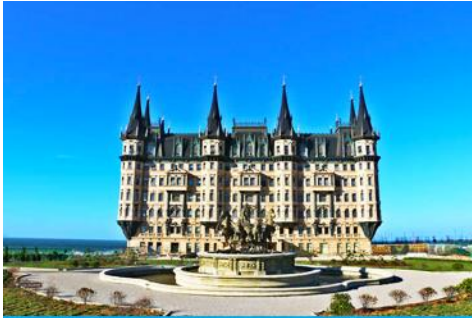
คฤหาสน์เหวินเจี๋ย