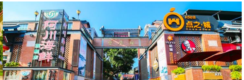
หมู่บ้านชาวประมง เจิงซัวอัน