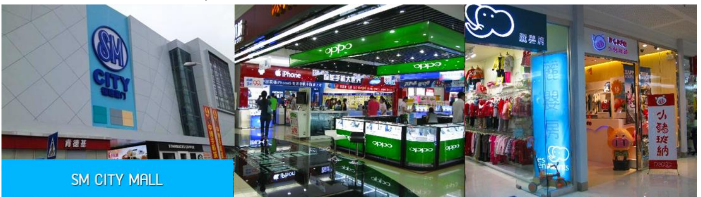
SM CITY MALL

จากนั้นนำท่านสู่ SM CITY MALL ให้ท่านมีเวลาอิสระเพื่อเดินชมและเลือกซื้อสินค้าหลากหลายภายในศูนย์การค้าขนาดใหญ่ใจกลางเมืองเซี่ยะเหมิน หรือท่านสามารถเลือกซื้อสินค้าเมืองราคาพิเศษจากห้าง WALMART ซึ่งอยู่ติดกับห้าง SM CITY MALL