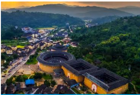
บ้านดินโบราณคูโหลวกาเป่ย์

พักที่ โรงแรม HAKKA EARTH BUILDING PRINCE HOTEL 4* หรือเทียบเท่าในเมืองหย่งคิง