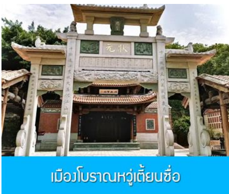
เมืองโบราณหวู่เตี้ยนซื่อ

พักที่ โรงแรม XIAMEN HENGLONG HOTEL 4* หรือเทียบเท่าในเมืองเซี่ยเหมิน