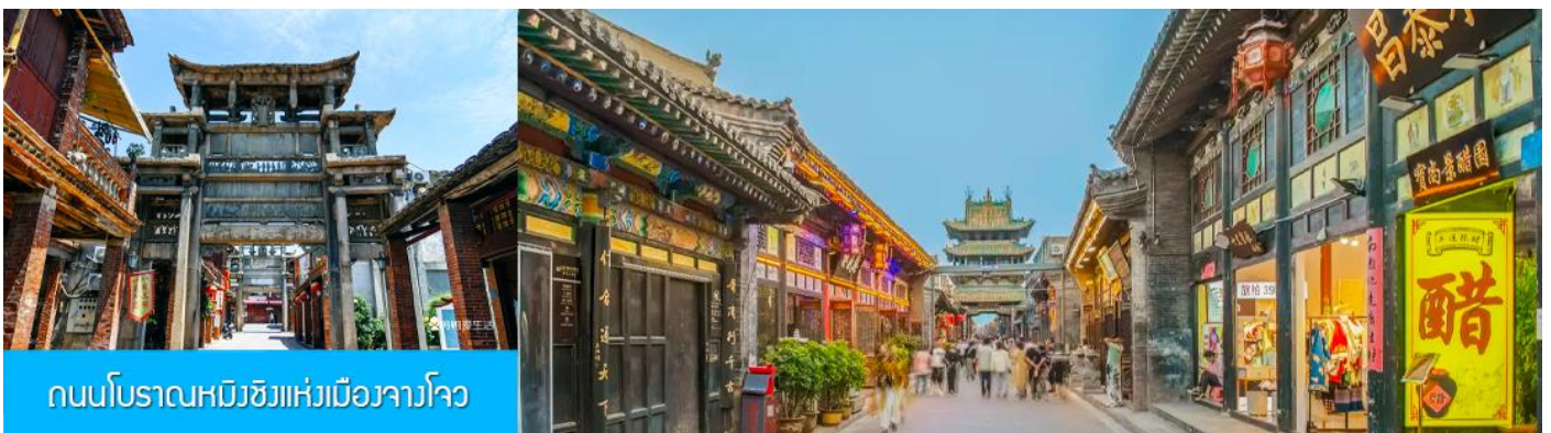
ถนนโบราณหมิงชิงแห่งเมืองจางโจว