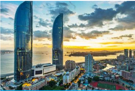
นครเซี่ยเหมิน