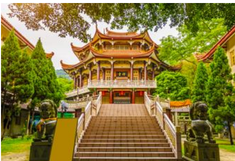
วัดหนานถั่วชื่อ

พักที่ โรงแรม XIAMEN HENGLONG HOTEL 4* หรือเทียบเท่าในเมืองเซี่ยเหมิน