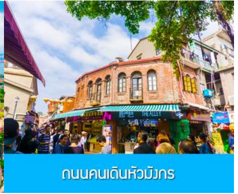
ถนนคนเดินหัวมังกร