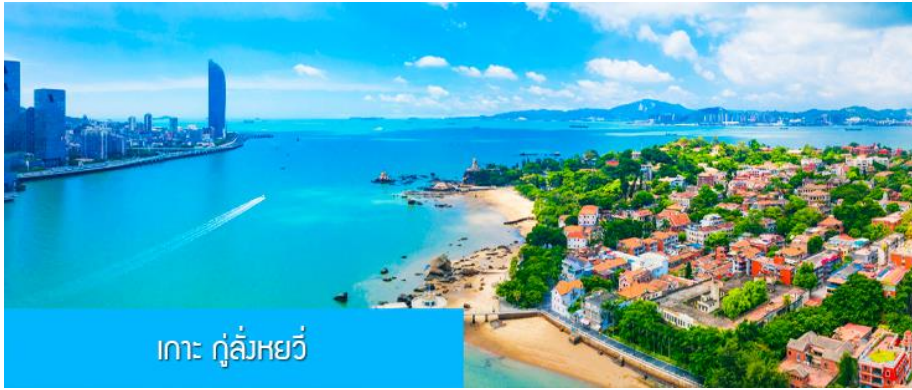
เกาะ กู่ลิ่งหยวี