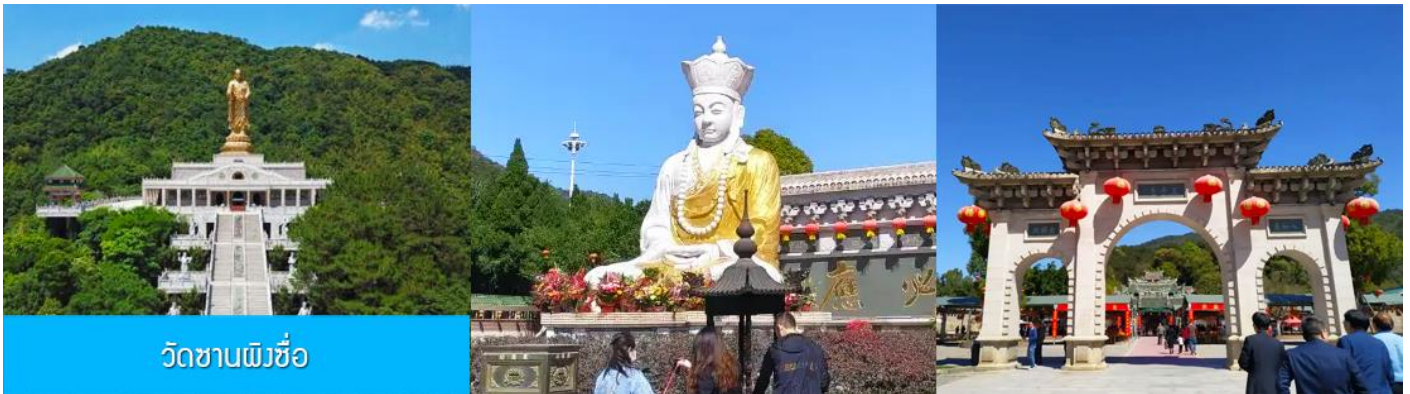
วัดซานผิงซื่อ

หลังอาหารนำท่านเดินทางโดยรถบัสสู่ เมืองจางโจว 漳州 (ระยะทาง 159 กม.ใช้เวลาเดินทางราว 2 ชั่วโมงเศษ)