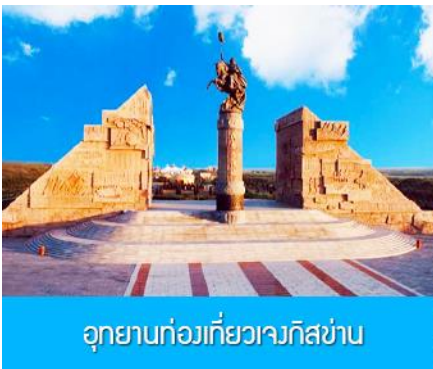
อุทยานท่องเที่ยวเจงกิสข่าน