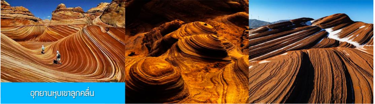
อุทยานหุบเขาลูกคลื่น