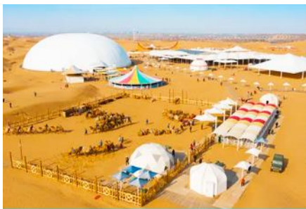
เกาะกลางทะเลทรายเขียนซาเต๋า