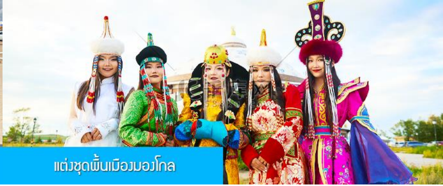
แต่งชุดพื้นเมืองมองโกล