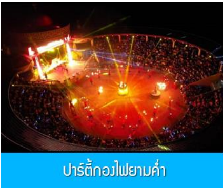
ปาร์ตี้กองไฟยามค่ำ