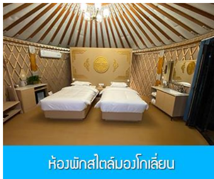
ห้องพักสไตล์มองโกลลิ้น