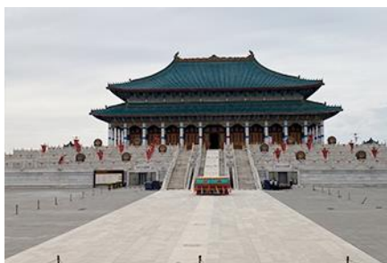
สวนวัฒนธรรม หมงกู่หยวนหลิว

เที่ยง รับประทานอาหารกลางวัน ณ ภัตตาคาร (14) หลังอาหารนำท่าน เที่ยวชม จวนอ๋องจวินหวัง 郡王府 จวนแห่งนี้เริ่มสร้างขึ้นในปี ค.ศ. 1902 สร้างเสร็จในปี ค.ศ. 1936 เป็นที่พำนักของ อ๋องอี้จวินหวัง 伊旗郡王 เป็นจวนอ๋องเพียงหนึ่งเดียวที่ได้รับการอนุรักษ์ในสภาพที่สมบูรณ์ โครงสร้างทำด้วยอิฐ หิน และไม้ ประกอบด้วยห้องพัก 16 ห้อง เป็นสถาปัตยกรรมผสมแบบมองโกลทิเบต และฮั่น