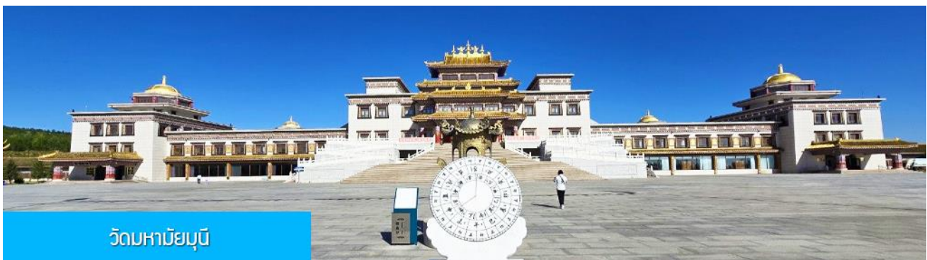
วัดมหาชัยมุนี

พักที่ YULIN CHAOYANG INTER HOTEL โรงแรมระดับ 4 ดาวท้องถิ่น หรือเทียบเท่าในเมืองหยี่หลิน