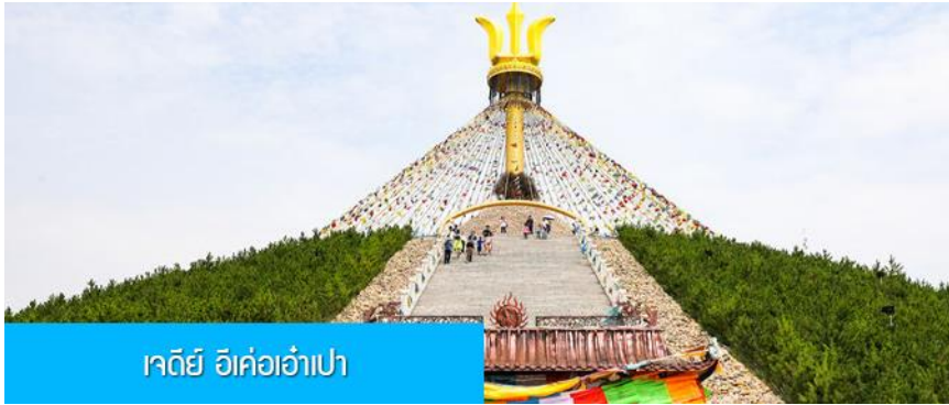
เจดีย์ อี้เค่อเอาเป่า

พักที่ DALAETQI SHNAGJING HOTEL โรงแรมระดับ 4 ดาวหรือเทียบเท่าในเมืองต้าลาเท่อ