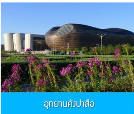
อุทยานคังปาสือ