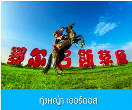
ทุ่งหญ้า เออร์ดอส

หลังอาหารนำท่านชม น้ำพุดนตรีคังปาสือ 康巴什音乐喷泉 ณ บริเวณจัตุรัสคังปาสือริมแม่น้ำวูหลันมู่หลุน ต้องบอกว่าเป็นน้ำพุดนตรี ที่ผสมผสานของน้ำพุ เสียงดนตรี แสงสี ได้อย่างลงตัวและสวยงาม ประกอบด้วย หัวฉีด 2970 หัว สปอร์ตไลท์ใต้น้ำ 1687 ดวง และเครื่องปั้มน้ำ 199 เครื่อง น้ำพุที่สูงสุดมีความสูงกว่า 200 เมตร เมื่อเสร็จจากการชมน้ำพุดนตรี นำท่านเดินทางเข้าโรงแรมที่พัก พักที่ ORDOS BOYU AIRUI HOTEL โรงแรมระดับ 4 ดาวท้องถิ่น หรือเทียบเท่าในเมืองเออร์ดอส