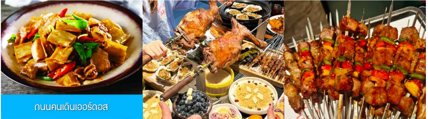
ถนนคนเดินเออร์ดอส

นำท่านเที่ยวชม สวนวัฒนธรรมหมงู่หยวนหลิว 蒙古源流 เป็นอุทยานท่องเที่ยวเชิงประวัติศาสตร์และวัฒนธรรมระดับ 4A ของจีน ที่เป็นต้นกำเนิดของชนชาติและวัฒนธรรมมองโกล สะท้อนความเป็นจักรวรรดิที่ยิ่งใหญ่เมื่อ 700 ปีก่อน ชม ประตูงเทียน 崇天门 สุคนโพนพารที่แสดงถึงความยิ่งใหญ่ของจักรวรรดิมองโกล ชม จัตุรัสถึงเกอหลี่ 腾格里广场 จัตุรัสกลางแจ้งขนาดใหญ่ที่ใช้ประกอบพิธีกรรมต่าง ๆ