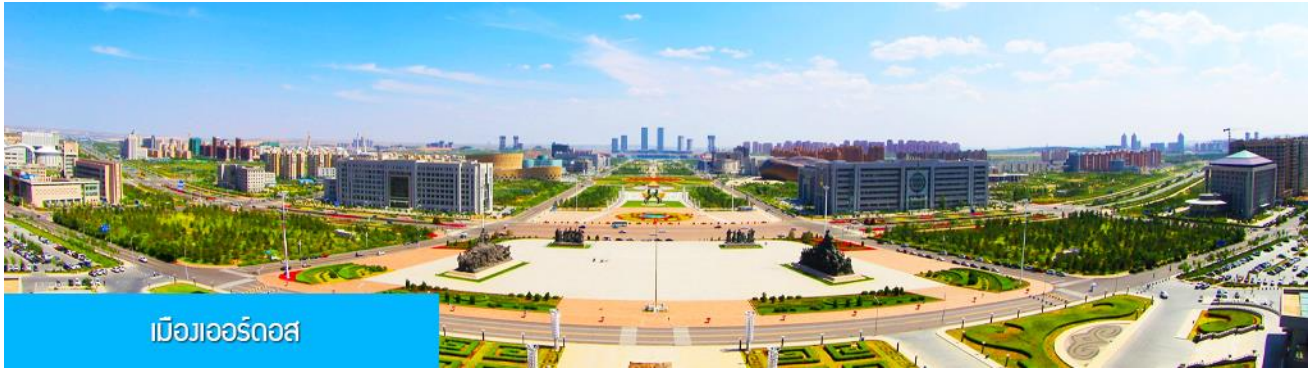
เมืองเออร์ดอส