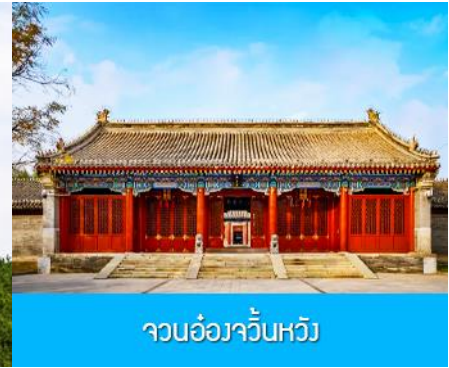
จวนอ๋องจวินหวัง

วันที่หก เมืองเออร์ดอส –อี้เค่อเอาเป่า–พิพิธภัณฑ์เครื่องเงิน-จวนอ๋องจวินหวัง- สวนวัฒนธรรมหมงกู่หยวน หลิว- ช้อปปิ้งถนนคนเดิน