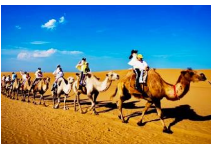
เป็นทรายเสียงชาวาน

เที่ยง รับประทานอาหารกลางวัน ณ ภัตตาคาร (11)