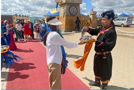
พิธีต้อนรับแขกด้วยเหล้า