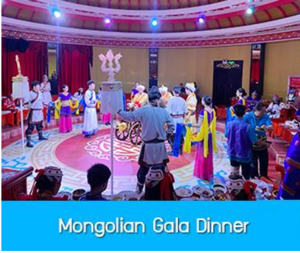
Mongolian Gala Dinner