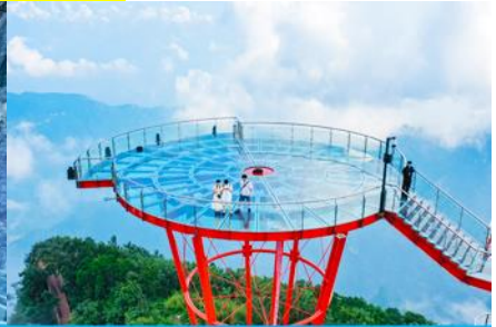
ระเบียงชมวิว Sky Eye