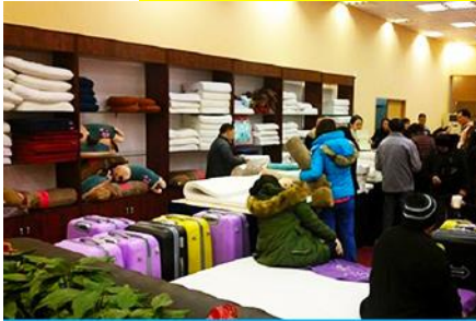
ศูนย์จำหน่ายผลิตภัณฑียางพารา