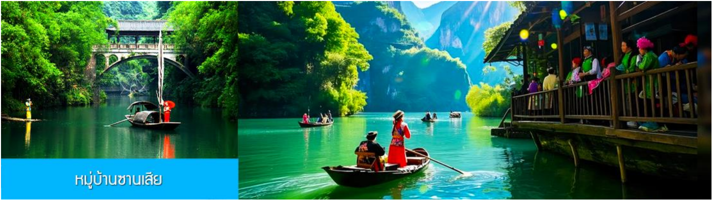
หมู่บ้านชาเบเลีย