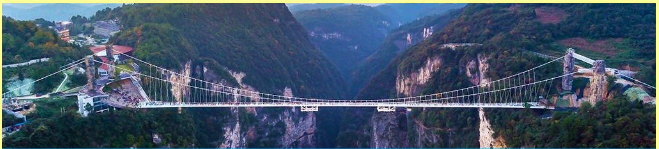
สะพานกระจากข้ามหุบเขาแกรนด์แคนยอน

หลังอาหารเช้าให้ท่านพักผ่อนตามอัธยาศัยในโรงแรม หรือ ท่านสามารถเลือกซื้อโปรแกรมเสริม OPTIONAL TOUR ซึ่งเป็นโปรแกรมท่องเที่ยวที่ไม่ได้รวมอยู่ในรายการท่องเที่ยว ได้แก่