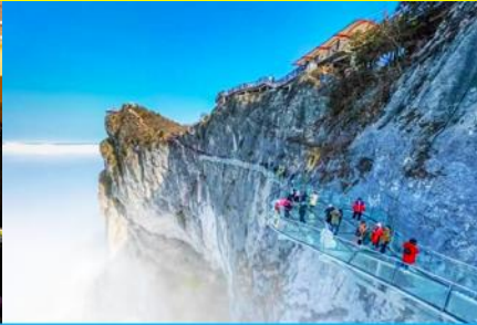
ระเบียงทางเดินกระจกเลียบบหน้าผา