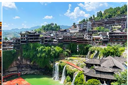
เมืองโบราณฟูหมิงจิน