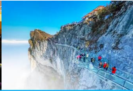
ระเบียงทางเดินกระจกเลียบนหน้าผา