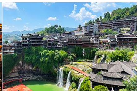
เมืองโบราณฟูหวงจิน