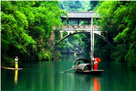
หมู่บ้านชาเลีย