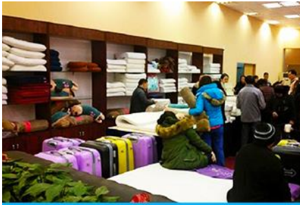
ศูนย์จำหน่ายผลิตภัณฑ์ยวพารา