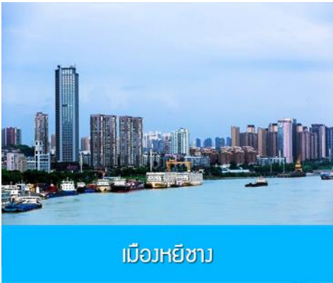
เมืองหยีซาง