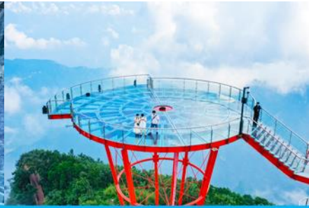
ระเบียงชมวิว Sky Eye

วันที่ 11 พิพิธภัณฑภาพเขียนหินทราย-ศูนย์ผลิตภัณฑ์ที่ทำจากยางพารา – กระเช้าขึ้นเขาเจ็ดดาว – ระเบียงแก้วเลียบนหน้าผา ระเบียงชมวิว SKY EYE – (ไกด์นำเสนอโปรแกรมเสริม ชุดโชว์จิ้งจอกขาว)