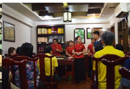
ร้านใบชา