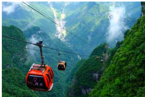
เขาเจ็ดดาว

เที่ยง รับประทานอาหารกลางวัน ณ ภัตตาคาร **บุฟเฟ่ต์หมูย่างเกาหลี (8)