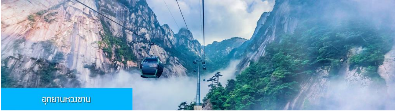
อุทยานหวางซาน