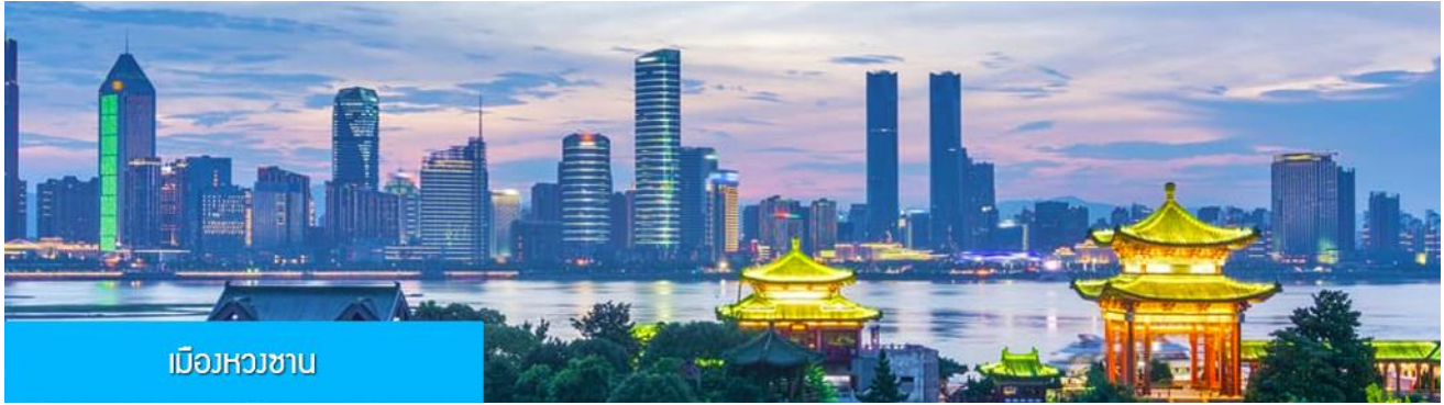
เมืองหวงชาน