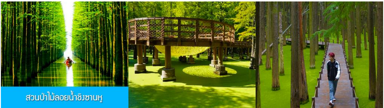
สวนป่าไม้ลอยน้ำชิงชานหู