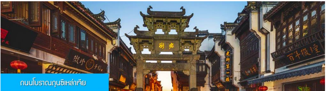
ถนนโบราณถุนซีเหล่าเจีย

นำท่านเที่ยวชม ถนนโบราณถุนซีเหล่าเจีย 屯溪老街 ถนนที่เป็นย่านการค้าโบราณในยุคราชวงศ์ช่งอายุกว่าพันปี ถนนมีความยาวราว 980 เมตร สองฝั่งถนนมีอาคารบ้านเรือนโบราณสไตล์หุ่ยโจว ยุคปลายราชวงศ์หมิงและราชวงศ์ชิงที่ถูกอนุรักษ์ไว้เป็นอย่างดี ปัจจุบันยังมีห้างร้าน โบราณ อาทิ ร้านขายโบราณวัตถุ ร้านขายหยก ร้านขายภาพเขียนและอักษรพู่กันโบราณ ร้านอาหารพื้นเมือง ร้านขายของที่ระลึก ฯลฯ นอกจากร้านค้าและ