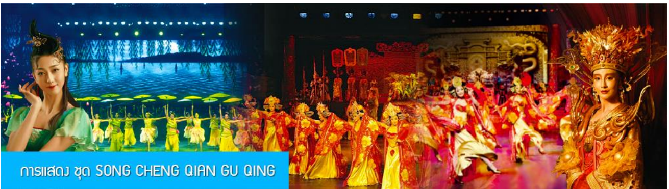
การแสดง ชุด SONG CHENG QIAN GU QING