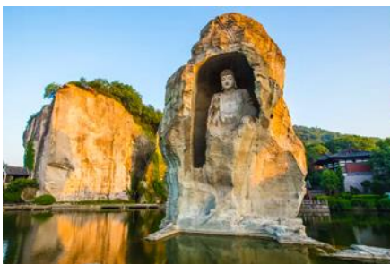
อุทยานเคอเหยียน

พักที่ โรงแรม KAIYUAN MINGTING HOTEL 4* หรือเทียบเท่าในเมืองเส้าชิง