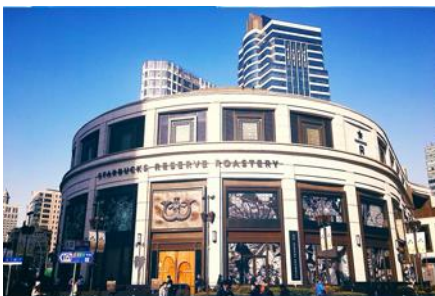
Starbuck Reserve Roastery

พักที่ โรงแรม Tongpai Hotel Or Holiday inn express Hotel 4* หรือเทียบเท่าในเมืองเซี่ยงไฮ้