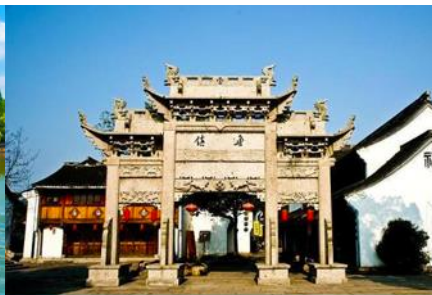
เมืองโบราณ หลู่เจิน