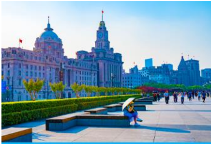
หาดว่อกาน