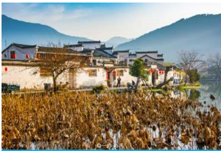
หมู่บ้านโบราณหงซุน

พักที่ โรงแรม QISHUHU HOTEL OR ZHONGCHENG SHANZHUANG 4* หรือเทียบเท่าในเขตอุทยานหวงซาน