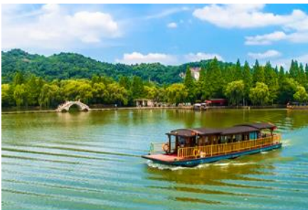
ล่องเรือทะเลสาบเจียนหู