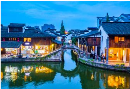
เมืองโบราณเคอเฉียว