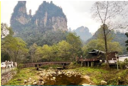
จุดชมวิวจีนเปียนซี

โทรศัพท์ : 042-246662 / 086-4515274 E-mail : journeyticket@hotmail.com