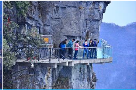
หน้าพลาวย้ำากาเดินกระจก

วันที่ 1 พิพิธภัณฑภาพเขียนหินทราย-ศูนย์แพทย์แผนจีน- กระเช้าขึ้นเขาเทียนเหมินซาน – ระเบียบแก้ว เลียบน้ำผา – บ้านไต้เลื่อนทะเลภูเขา – (เลือกซื้อโปรแกรม ออฟชั่น โชว์จิ้งจอกขาว)