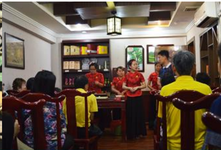
ร้านใบชา