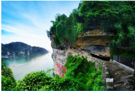
สวนถ้ำสามสหาย

โทรศัพท์ : 042-246662 / 086-4515274 E-mail : journeyticket@hotmail.com