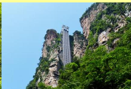
ลิฟท์แก้วไปหลง