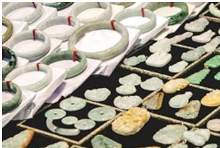
ศูนย์จำหน่ายผลิตภัณฑ์หยก

หลังอาหารนำท่านเดินทางเข้าที่พัก หรือท่านสามารถเลือกซื้อโปรแกรมเสริม เป็นบัตรชมการแสดง ชุด The Love Story of a Wooden man and Fairy fox หรือที่เรียกกันในหมู่นักท่องเที่ยวไทยว่า โซ่วจิ้งจอกขาว เป็นการแสดงกลางแจ้งที่ทุ่มทุนสร้างอย่างสุดอลังการ เป็นการแสดงที่น่าดูชมที่สุดในเมืองจางเจียเจี๋ย การแสดงชุดนี้ใช้ภูเขาประติมากรรมเป็นฉากหลังประกอบการแสดง ซึ่งให้ความรู้ลึกซึ้งสมจริงเสมือนผู้ชมและนักแสดงอยู่ท่ามกลางธรรมชาติ ใช้ทีมงานนักแสดงหลายร้อยคน พร้อมระบบแสง สี เสียงที่ทันสมัยประกอบการแสดง อัตราค่าบริการสำหรับโปรแกรมเสริมการแสดงชุด The love Story of Wooden man and Fairy Fox ท่านละ 400 หยวน (หรือ 2,000 บาทขึ้นอยู่กับอัตราแลกเปลี่ยน) ระยะเวลาที่ใช้ในการเที่ยวชมการแสดง ประมาณ 3 ชั่วโมง รวมเวลาเดินทางไป กลับค่าบริการรวม ค่าบัตรเข้าชม ค่ารถรับ ส่ง และค่าน้ำที่วิวของไคด์ท้องถิ่น พักที่ ZHENMIAN HOTEL โรงแรมระดับ 4 ดาวหรือเทียบเท่า