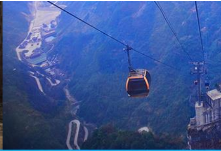
กระเช้าขึ้นเขาเทียนเหมินซาน