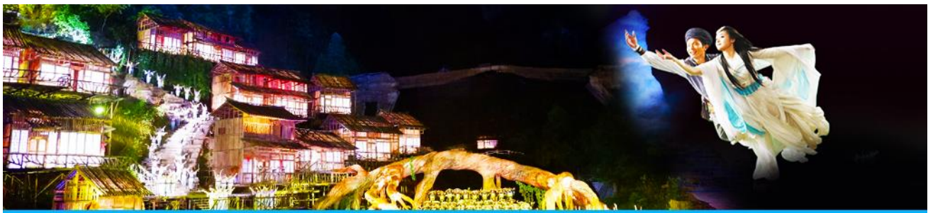
The Love Story of a Wooden Man and Fairy fox

เนื่องจากอุทยานเทียนเหมินซานมียอดจองตัวดวงหน้าที่หนาแน่นในช่วงฤดูท่องเที่ยวและช่วงวันหยุดยาวของจีน ทางผู้จัดทัวร์ของสวนสิทธิ์ในการจัดโปรแกรมเที่ยวภูเขาเทียนเหมินซาน ได้ทั้งแบบ Route A และ Route B ทั้งนี้ขึ้นอยู่กับความซ้ำเร็วในการส่งข้อมูลส่วนตัว(หน้าพาสปอร์ต)ในการจองทัวร์ดวงหน้าของแต่ละคณะ