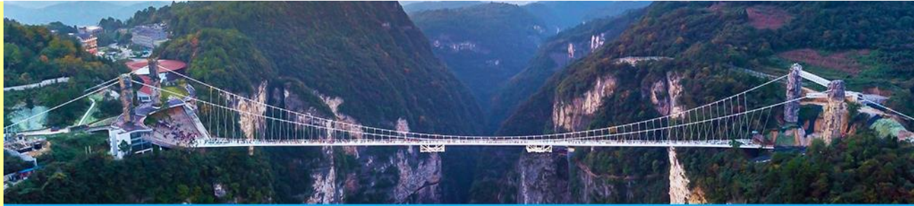
สะพานกระจากข้ามหุบเขาแกรนด์แคนยอน

โทรศัพท์ : 042-246662 / 086-4515274 E-mail : journeyticket@hotmail.com