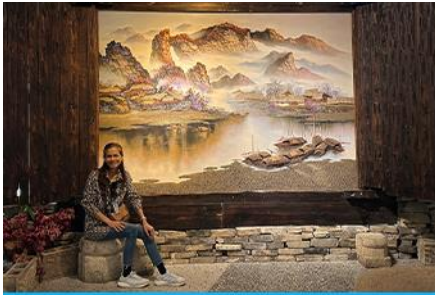
พิพิธภัณฑ์ภาพเขียนหินทราย

โทรศัพท์ : 042-246662 / 086-4515274 E-mail : journeyticket@hotmail.com