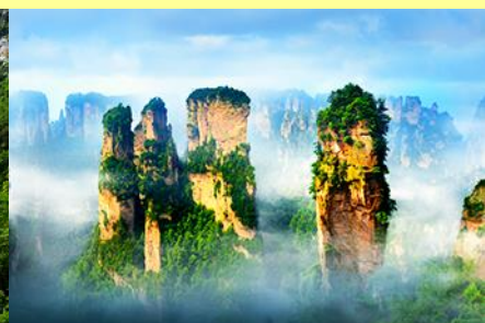
ภูเขาอวตาร

โปรแกรมเสริมที่ 2 โปรแกรมเที่ยวชมอุทยานภูเขาอวตารแบบครึ่งวันที่รวมค่าขึ้นลิฟท์แก้ว (ผู้เข้าร่วมขั้นต่ำ 15 ท่าน) ใช้เวลาประมาณ 4-6 ชั่วโมง (ขึ้นอยู่กับจำนวนนักท่องเที่ยวในแต่ละวัน) อัตราค่าบริการท่านละ 750 หยวนหรือ 3,750 บาท นำท่านเที่ยวชมจุดชมวิวลำธารจินเปียนซีที่สามารถมองเห็นวิวยอดเขาอวตารได้ชัดเจน นำท่านเที่ยวชมจุดชมวิวจินเปียนซีที่สามารถมองเห็นทัศนียภาพของภูเขาอวตารและลิฟท์แก้วได้ชัดเจน นำท่านขึ้นลิฟท์แก้วขึ้นสู่ยอดเขาอวตาร นำท่านเดินชมจุดชมวิวด่าง ๆ บนยอดเขาอวตารได้แก่ภูเขาฮาเลลูย่า สะพานหนึ่งโนได้หล้า... อัตราค่าบริการรวม ค่าบัตรเข้าอุทยาน ค่ารถรับส่งภายในเขตอุทยาน ค่าน้ำดื่มของไกด์ท้องถิ่น