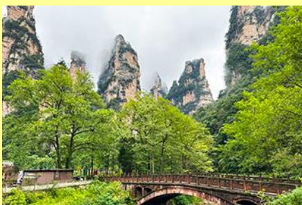
จุดชมวิวจีนเปียนซี

โปรแกรมเสริมที่ 1 โปรแกรมเที่ยวชมอุทยานภูเขาอวตารแบบลันที่ไม่ขึ้นลิฟท์แก้ว (ผู้เข้าร่วมขั้นต่ำ 15 ท่าน) ใช้เวลาประมาณ 2-3 ชั่วโมง อัตราค่าบริการท่านละ 400 หยวนหรือ 2,000 บาท นำท่านเที่ยวชมจุดชมวิวลำธารจินเปียนซีที่สามารถมองเห็นวิวยอดเขาอวตารได้ชัดเจน นำท่านเที่ยวชมจุดชมวิวจินเปียนซีที่สามารถมองเห็นทัศนียภาพของภูเขาอวตารและลิฟท์แก้วได้ชัดเจน (ไม่ได้รวมค่าขึ้นลิฟท์แก้ว) อัตราค่าบริการรวม ค่าบัตรเข้าอุทยาน ค่ารถรับส่งภายในเขตอุทยาน ค่าน้ำดื่มของไกด์ท้องถิ่น