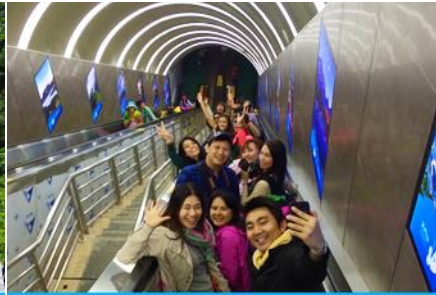
บันไดเลื่อนทะลุภูเขา