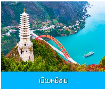
เมืองหยีซาง