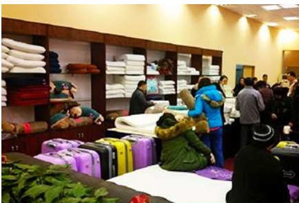
ศูนย์จำหน่ายผลิตภัณฑ์ยางพารา

พักที่ ZHENMIAN HOTEL OR YINXIANG HOTEL ระดับ 4 ดาวท้องถิ่นหรือเทียบเท่าในเมืองจางเจี๋ยเจี๋ย