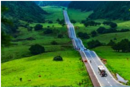
อุทยานเขานางฟ้า

พักที่ MOUNTAIN VIEW HTL // DAWEIYING HTL โรงแรมระดับ 4 ดาวหรือเทียบเท่าในเมืองอู่หลง