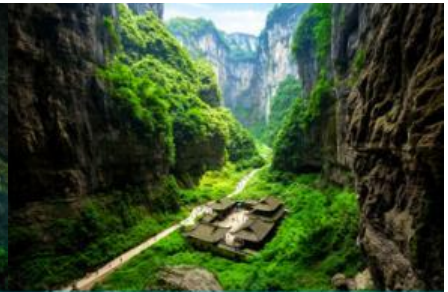
สะพานธรรมชาติสามแห่ง