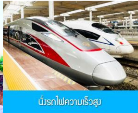
ขบวนรถไฟความเร็วสูง