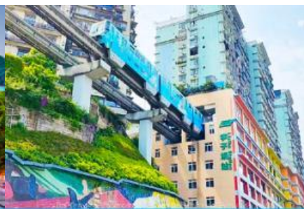
รถไฟวังก์สุติก