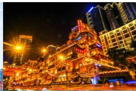
ย่านหวงหยาดัง