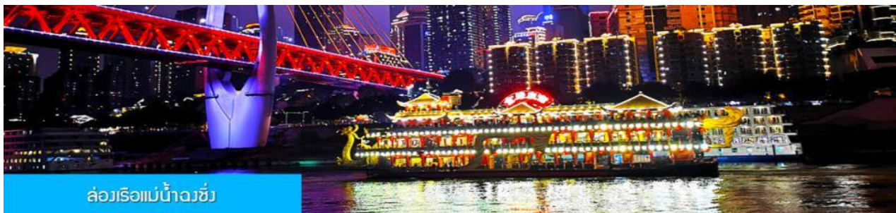
ล่องเรือแม่น้ำฉงชิ่ง

พักที่ HAITANGLIZHI HOTEL โรงแรมระดับ 4 ดาวหรือเทียบเท่าในเมืองฉงชิ่ง