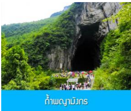
ถ้ำพญามังกร

พักที่ VIENNA HOTEL โรงแรมระดับ 4 ดาวหรือเทียบเท่าในเมืองเอนซือ