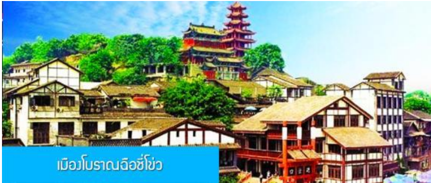
เมืองโบราณฉือโจ้ว

โทรศัพท์ : 042-246662 / 086-4515274 E-mail : journeyticket@hotmail.com