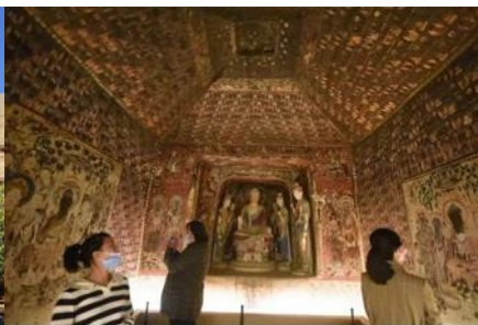
ชมภาพยนตร์ 3 มิติ