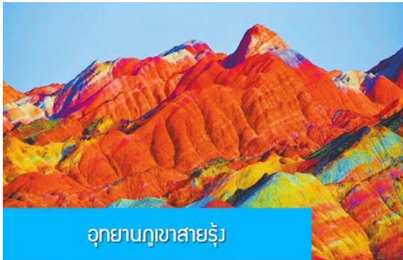
อุทยานภูเขาสายรุ้ง

โทรศัพท์ : 042-246662 / 086-4515274 E-mail : journeyticket@hotmail.com