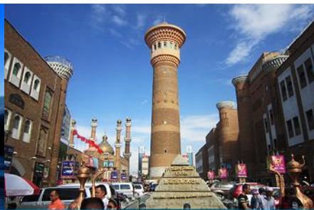
ตลาดต้าปาจา