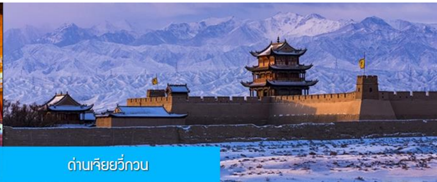
ด่านเจียยวี่กวน

วันที่สาม เมืองจางเจี้ยน – วัดพระใหญ่เมืองจางเจี้ยน –เดินทางสู่เมืองเจียยวี่กวน-ด่านเจียยวี่กวน