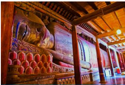
วัดพระใหญ่

พักที่ SILU QIAN XI HOTEL โรงแรมระดับ 4 ดาวท้องถิ่น หรือเทียบเท่าในเมืองจางเจี้ยน