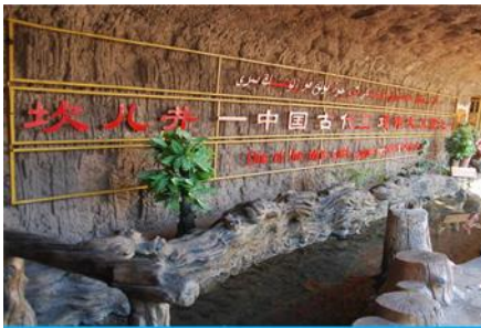
ระบบชลประทานถู่หลู่ฟาน

พักที่ HAMPTON BY HILTON HOTEL โรงแรมระดับ 4 ดาวหรือเทียบเท่าในเมืองถู่หลู่ฟาน