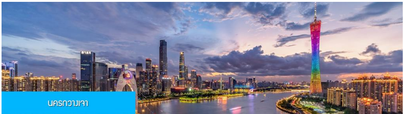
นครกวางเจา