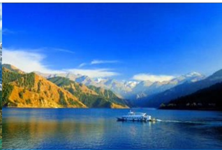
ล่องเรือทะเลสาบเทียนฉือ