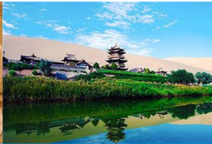
สระน้ำวังพระจันทร์