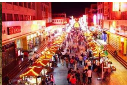
ตลาดกลางคืน ซาโจว

วันที่สี่ ด่านเจียยวี่กวน – เดินทางสู่เมืองตุนหวง – เที่ยวชมถ้ำมั่วเกาคุ –ชมภาพยนตร์ 3 มิติ-ซาโจวไนท์มาร์เก็ต