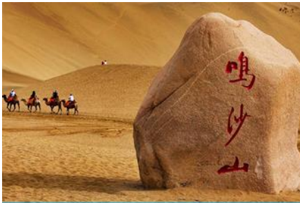
เนินทรายหมิงซาซาน

หลังอาหารให้ท่าน มีเวลาเดินเล่น ช้อปปิ้งใน ตลาดกลางคืน ซาโจว 沙洲夜市 ให้ท่านเลือกซื้อของที่ระลึกของเส้นทางสายไหมได้ตามอัธยาศัย