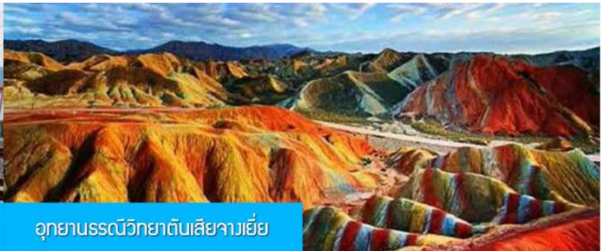
อุทยานธรณีวิทยาตันเสียวเจีย

วันที่สอง เมืองหลันโจว – นั้รรถไฟความเร็วสูงสู่เมืองจางเจีย – เที่ยวชมอุทยานธรณีวิทยาตันเสียว(ภูเขาสายรุ้ง)