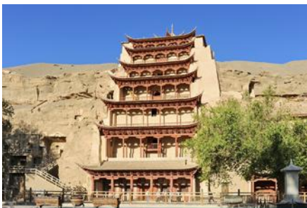
ถ้ำหินมั่วเกาคุ

พักที่ REZEN HOTEL ระดับ 4 ดาวท้องถิ่นหรือเทียบเท่าในเมือง เจียยวี่กวน