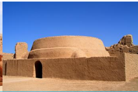
เมืองโบราณเกาซางถู่เจิง