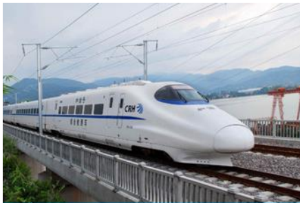
นั้รรถไฟความเร็วสูง

พักที่ MADISON WEST STATION HOTEL โรงแรมระดับ 4 ดาวท้องถิ่น หรือเทียบเท่าในเมืองหลันโจว