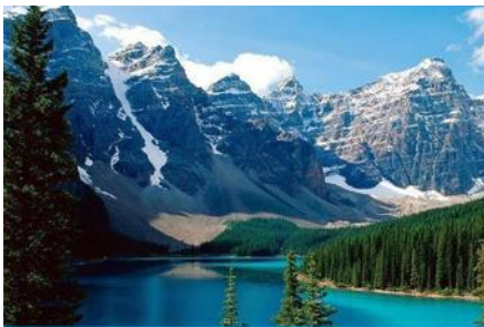
ภูเขาเทียนชาน

พักที่ MERCURE HOTEL โรงแรมระดับ 4 ดาวท้องถิ่นหรือเทียบเท่าในเมืองอูรูมูฉี