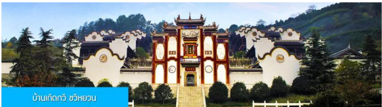
บ้านเกิดกวี ขวี่หยวน