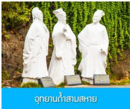
อุทยานถ้ำสามสหาย

พักที่ XIA ZHOU BINGUAN HOTEL โรงแรมระดับ 4 ดาวหรือเทียบเท่าใจกลางเมืองหยีชาง