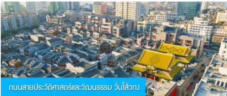
ถนนสายประวัติศาสตร์และวัฒนธรรม วันไ่ลั่วกวง

พักที่ โรงแรม JIANGNAN HAOTING HOTEL ระดับ 4 ดาวท้องถิ่นหรือเทียบเท่าในเมืองชั่งเหรา