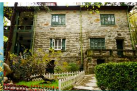
เรือนรับรอง หม่ยหลู

นำท่านเที่ยวชม อุทยานธรรมชาติเขาหลูซาน (รวมคำรถบัสรับส่งภายในอุทยาน) นำท่านชม สวนฮวาจิ้ง 花径公园 เป็นสวนดอกท้อที่ขึ้นชื่อภายในเขตอุทยาน ตั้งอยู่ริมทะเลสาบหฺรูฉิน เล่ากันว่าเป็นที่ซึ่งกวีชื่อดังสมัยราชวงศ์ถัง ไป๋จวีอี้ ได้เขียนบทกวีเรื่อง ดอกท้อในวัดต้าหลิน ขึ้นในสวนแห่งนี้ ภายในสวนมีศาลาเก๋งจีนที่รายล้อมด้วยต้นดอกท้อ (ดอกท้อจะเบ่งบานในฤดูใบไม้ผลิ) .....ชมความสวยงามของหุบเขา จิ้งชวู่ 锦绣谷景区