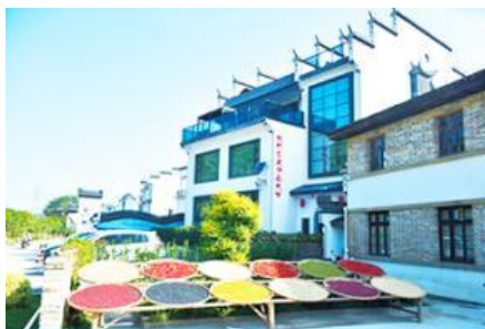
หมู่บ้านโบราณ สือหมินซุน

พักที่ โรงแรม JAMES JOYCE COFEETEL ระดับ 5 ดาวท้องถิ่นหรือเทียบเท่าในเมืองวู่หยวน