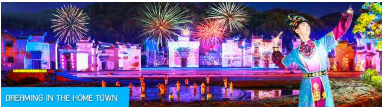
DREAMING IN THE HOME TOWN