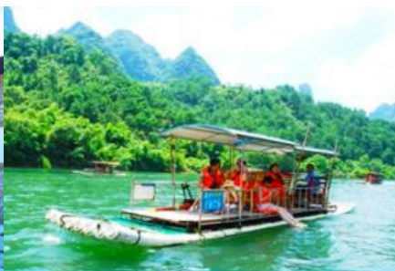
ล่องแพไม้ไผ่