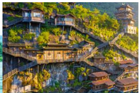
อุทยาน วู่หยวนกู่

วันที่ 1 เมืองวู่หยวน-หมู่บ้านโบราณเหยียนสือหมินซุน-ล่องแพไม้ไผ่ - เมืองซังเหลา - หุบเขาเทวดาวิ้งเจียนกู่