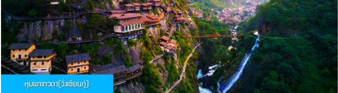
หมู่บ้านเกวตา(วิวเขียนกุ)

หลังอาหารนำท่านเดินทางสู่เมือง ชั่งเหรา 上饶 (ระยะทาง 127 กม. ใช้เวลาเดินทางโดยรถบัสราว 2 ชั่วโมง)