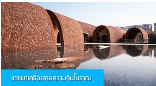
เตาเผาเครื่องลายครามจีนโบราณ