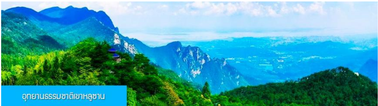
อุทยานธรรมชาติหลูซาน

พักที่ LUSHAN GULING HOTEL / LONGHAO HPLIDAY โรงแรมระดับ 4 ดาวท้องถิ่นหรือเทียบเท่าใน เมืองหลูซาน