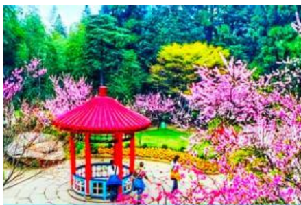
สวนฮวาจิ้ง