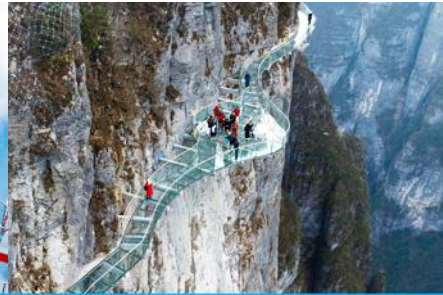
ระเบียงทางเดินเลียบบหน้าผา

วันที่สาม จางเจียเจี้ย-ศูนย์สมุนไพรจีน-ผลิตภัณฑ์ยางพารา- กระเช้าขึ้น/ลงเขาเจ็ดดาว – ระเบียงชมวิว Sky Eye - ระเบียงทางเดินเลียบบหน้าผา – (เลือกซื้อโปรแกรมเสริม โชว์จิ้งจอกขาว)