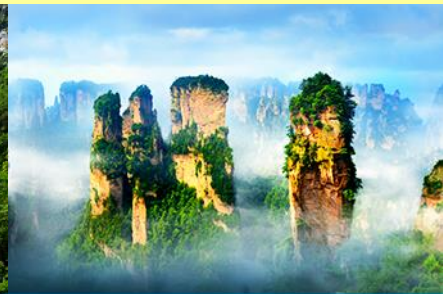
ภูเขาหวงตาร

โปรแกรมเสริมที่ 2 โปรแกรมเที่ยวชมอุทยานภูเขาวงกตแบบครึ่งวันที่รวมค่าขึ้นลิฟท์แก้ว (ผู้เข้าร่วมขั้นต่ำ 15 ท่าน) ใช้เวลาประมาณ 4-6 ชั่วโมง (ขึ้นอยู่กับจำนวนนักท่องเที่ยวในแต่ละวัน) อัตราค่าบริการท่านละ 750 หยวนหรือ 3,750 บาท นำท่านเที่ยวชมจุดชมวิวลำธารจินเปียนซีที่สามารถมองเห็นวิวยอดเขาวงกตได้ชัดเจน นำท่านเที่ยวชมจุดชมวิวจินเปียนซีที่สามารถมองเห็นทัศนียภาพของภูเขาวงกตและลิฟท์แก้วได้ชัดเจน นำท่านขึ้นลิฟท์แก้วขึ้นสู่ยอดเขาวงกต นำท่านเดินชมจุดชมวิวด่าง ๆ บนยอดเขาวงกตได้แก่ภูเขาฮาเลลูย่า สะพานหนึ่งในได้หล้า... อัตราค่าบริการรวม ค่าบัตรเข้าอุทยาน ค่ารถรับส่งภายในเขตอุทยาน ค่าน้ำดื่มของไกด์ท้องถิ่น