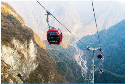
กระเช้าขึ้น/ลงเขาเจ็ดดาว

โทรศัพท์ : 042-246662 / 086-4515274 E-mail : journeyticket@hotmail.com