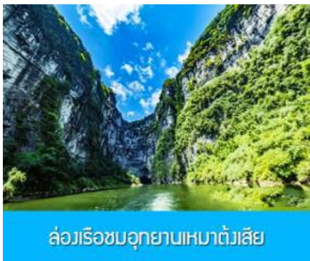
ล่องเรือชมอุทยานเหมาดังเสี่ย