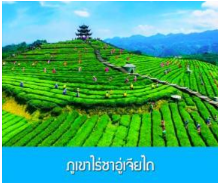
ภูเขาไร่ชาอู๋เจียไถ

โทรศัพท์ : 042-246662 / 086-4515274 E-mail : journeyticket@hotmail.com