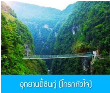
อุทยานตี้ซินกู่ (โกรกหัวใจ)

พักที่ โรงแรม ENSHI XIPU HOTEL ระดับ 4 ดาวท้องถิ่นหรือเทียบเท่าในเมืองเอินซือ