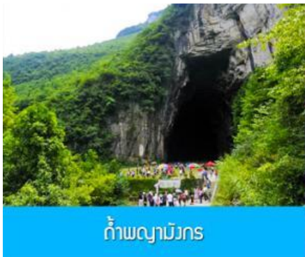
ถ้ำผญามังกร

พักที่ YICHANG HUIHAO HOTEL โรงแรมระดับ 4 ดาวหรือเทียบเท่าในเมืองหยี่ซัง