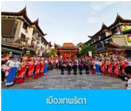
เมืองเทพริดา