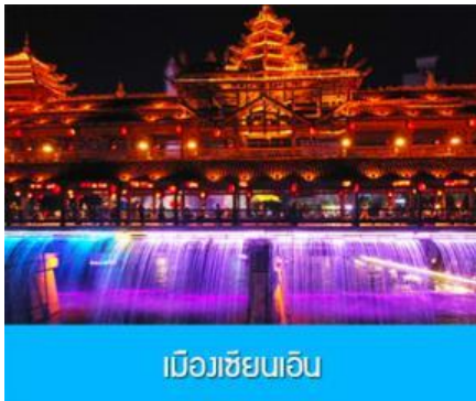
เมืองเซียนเอิน