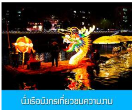
นั่งเรือมังกรเที่ยวชมความงาม