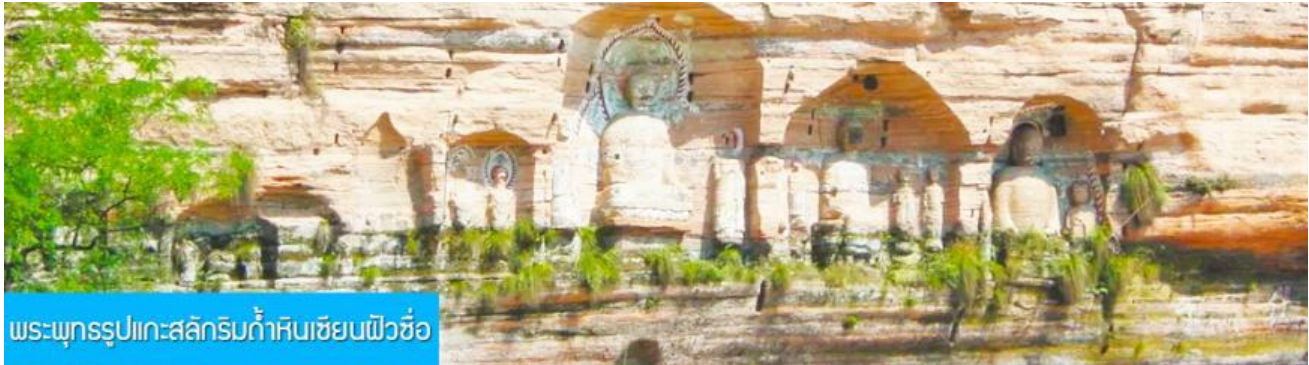
พระพุทธรูปแกะสลักหินที่ถ้ำหินเซียนฝัวซื่อ

โทรศัพท์ : 042-246662 / 086-4515274 E-mail : journeyticket@hotmail.com