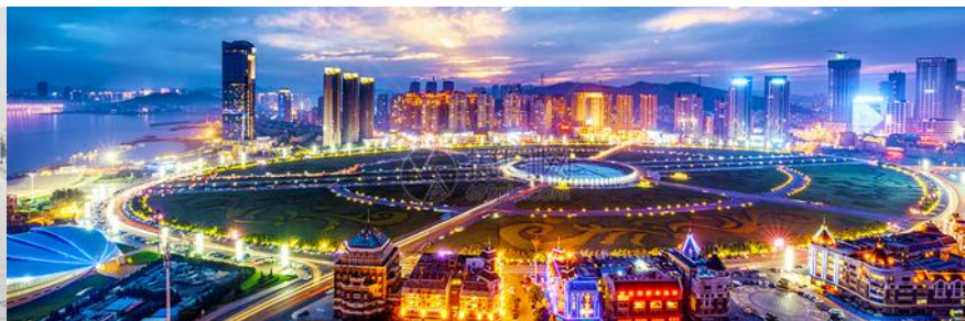
จัตุรัสซิงไห่