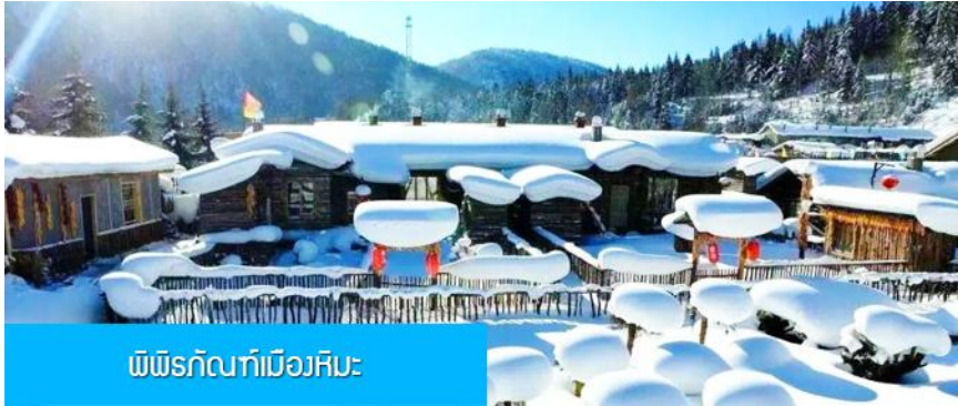
พิพิธภัณฑ์เมืองหิมะ

มาคอบริการกระเป๋าให้ผู้เข้าพัก ท่านควรจัดเตรียมกระเป๋าใบเล็กที่บรรจุเสื้อผ้า และเครื่องใช้จำเป็นสำหรับการพักผ่อน ณ โฮมสเตย์ในเมืองหิมะในคืนนี้ เพื่อสะดวกต่อการเคลื่อนย้ายกระเป๋า, และภายในห้องพักจะไม่มีผ้าเช็ดตัวผืนใหญ่ จะมีเพียงถุง แห่มปูบริการทุกโรงแรม ท่านควรเตรียมแปรงสีฟันยาสีฟันติดไปด้วย