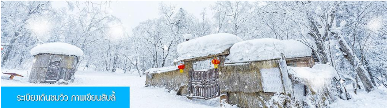
ระเบียบเดินชมวิว ภาพเขียนสิบลิ

โทรศัพท์ : 042-246662 / 086-4515274 E-mail : journeyticket@hotmail.com