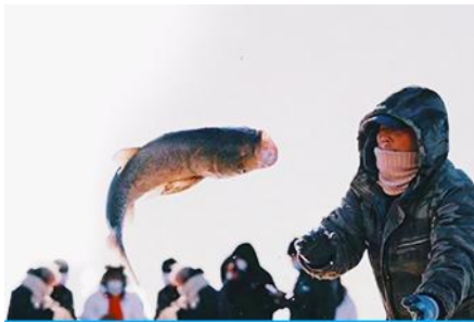
การจับปลาในฤดูหนาว

โทรศัพท์ : 042-246662 / 086-4515274 E-mail : journeyticket@hotmail.com