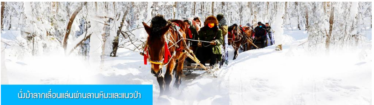
นั่งม้าลากเลื่อนเล่นผ่านลานหิมะและแนวป่า

รายการที่ 1 ระเบียบเดินชมวิว ภาพเขียนสิบลิ 冰雪十里画廊 เป็นการเดินชมวิวธรรมชาติตามเนินเขา ท่ามกลางแนวป่าที่มีต้นไม้ที่มีน้ำแข็งเกาะอยู่ตามกิ่งไม้ เป็นภาพวิวธรรมชาติดูหนาวที่สวยงามน่าประทับใจและพบได้เฉพาะในฤดูหนาวทางภาคอีสานของจีนเท่านั้น เวลาที่ใช้สำหรับโปรแกรมเสริมนี้ประมาณ 1 ชั่วโมง อัตราค่าบริการ ท่านละ 220 หยวน หรือ 1100 บาท อัตรานี้รวมค่าบริการผ่านเข้าอุทยาน ค่ารถรับ ส่ง และค่าบริการของไกด์ท้องถิ่น และค่าบริการจัดการของบริษัททัวร์ท้องถิ่น..... หมายเหตุ โปรแกรมเสริมเป็น โปรแกรมที่ท่านต้องเสียค่าใช้จ่ายเองด้วยความสมัครใจ สำหรับท่านที่ไม่เข้าร่วมกิจกรรมดังกล่าวสามารถนั่งพักในรถได้