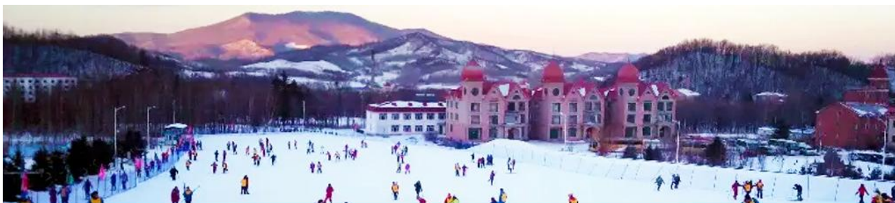
ลานสกียาบูลิ

พักที่ VODKA MANOR RESORT รีสอร์ทที่ตั้งอยู่ในอุทยานสวนสโนว์โดลส์รัสเซีย