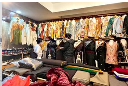
ศูนย์จำหน่ายอุปกรณ์กันหนาว