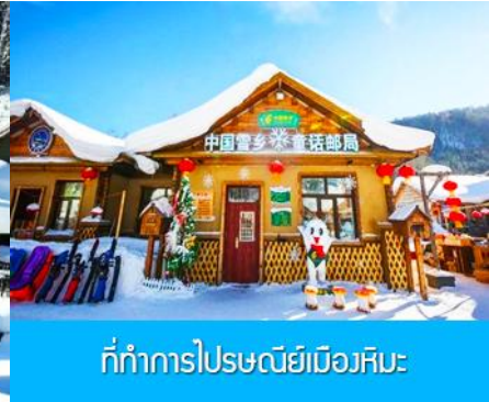
ที่ทำการไปรษณีย์เมืองหิมะ

วันที่สี่ พิพิธภัณฑ์เมืองหิมะ – ที่ทำการ ไปรษณีย์เมืองหิมะ - ไรด์ขายออฟชั่นภาพเขียนลิปส์-และออฟชั่น ม้าลากเลื่อน-เมืองฮาร์บิน