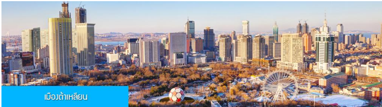
เมืองต้าเหลียน

โทรศัพท์ : 042-246662 / 086-4515274 E-mail : journeyticket@hotmail.com