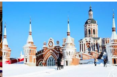
สวน LITTLE RUSSIA