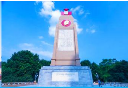
อนุสาวรีย์ฟางหว