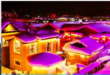
เมืองหิมะ Xue xiang