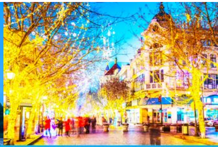
ถนนจางยู่