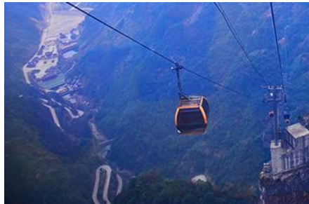
กระเช้าขึ้นเทียนเหมินซาน

พักที่ ZHENMIN HOTEL โรงแรมระดับ 4 ดาวหรือเทียบเท่า