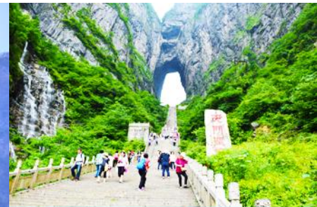
บันได 999 ขั้น