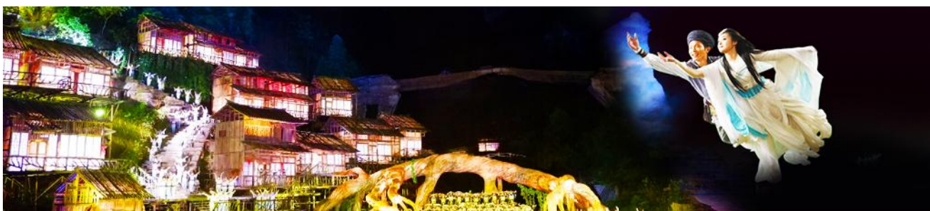
The Love Story of a Wooden Man and Fairy fox

รับประทานอาหารค่ำ ณ ภัตตาคาร ** บุฟเฟ่ต์ปิ้งย่างเกาหลี