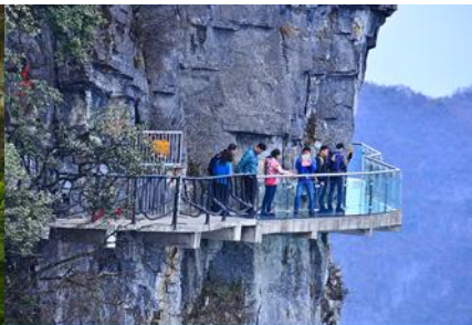
หน้าผาลอยฟ้าทางเดินกระจก