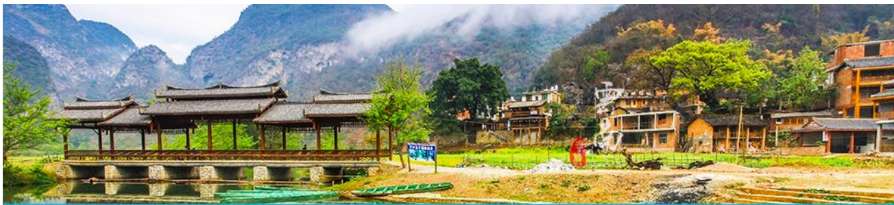
สวนดอกท้อ