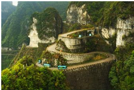
เส้นทาง 99 โค้ง

โทรศัพท์ : 042-246662 / 086-4515274 E-mail : journeyticket@hotmail.com