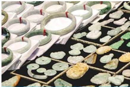
ศูนย์จำหน่ายผลิตภัณฑืหยก

https://hk.trip.com/hotels/guzhang-hotel-detail-68614854/chaxitai-holiday-hotel/