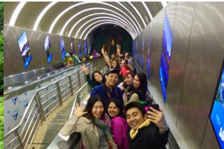
บันไดเลื่อนทะเลภูเขา