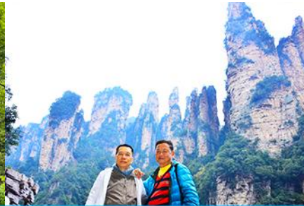
ชมจุดชมวิวลีฟท์แก้ว