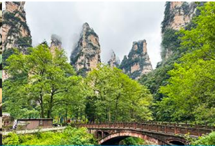
จุดชมวิวจินเปียนซี