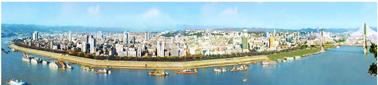
เมืองหยีซัง

-ไม่เก็บทิปก่อนเที่ยว เพราะมันใจในคุณภาพ