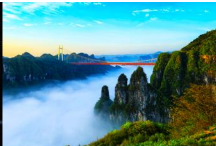
อุทยานป่าไผ่แห่งชาติไฉ่จ้าย