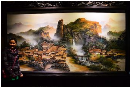
พิพิธภัณฑ์ภาพหินทราย

พักที่ ZHENMIN HOTEL โรงแรมระดับ 4 ดาวหรือเทียบเท่า