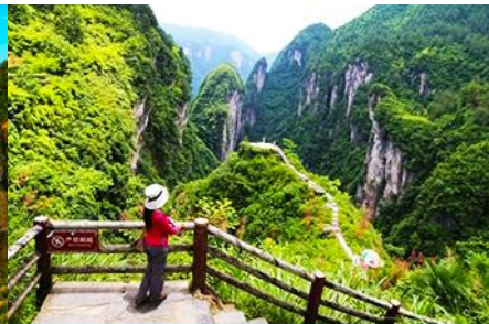
แท่น ปูจางสวรรค์