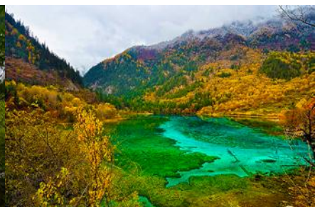
ทะเลสาบนกยูง (PEACOCK LAKE)

นำท่านชม ทะเลสาบยาว 长海 เหนือระดับน้ำทะเล 3,101 เมตร น้ำลึกโดยเฉลี่ย 90 เมตร ยาวราว 4.5 กิโลเมตร กว้าง 300 เมตร เป็นทะเลสาบที่มีขนาดใหญ่ และมีปริมาณน้ำมากที่สุดในอุทยานจิวจ้ายโกว ตั้งอยู่จุดเหนือสุดในอุทยาน น้ำในทะเลสาบยาวเกิดจากการละลายของหิมะบนภูเขา แม้ว่าทะเลสาบแห่งนี้จะไม่มีทางน้ำเข้าออก แต่ในฤดูร้อนและฤดูฝนน้ำในทะเลสาบก็จะไม่ล้นเอ่อท่วม และในฤดูหนาวที่แห้งแล้งน้ำในทะเลสาบก็ไม่แห้ง