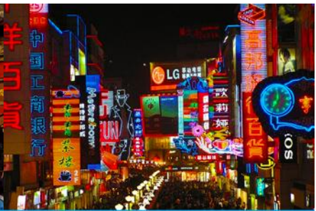
ถนนคนเดินซุนซีลู่