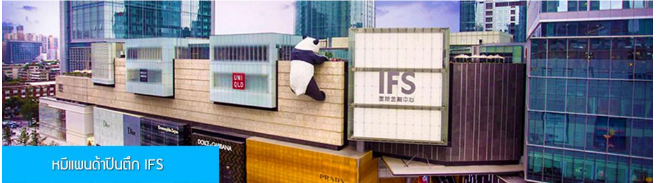
หมีแพนด้าปีนตึก IFS