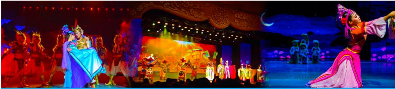
Romantic Show of Jiuzhai

โทรศัพท์ : 042-246662 / 086-4515274 E-mail : journeyticket@hotmail.com