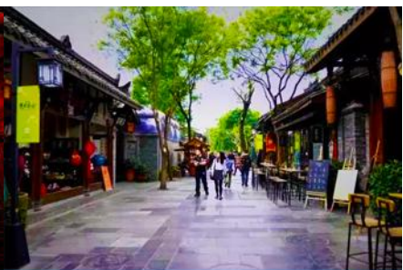
ชอยกวาง ชอยแคบ และชอยบ่อน้ำ

พักที่ SERENGTI HOTEL 4* หรือ โรงแรมระดับเดียวกัน เฉิงตู