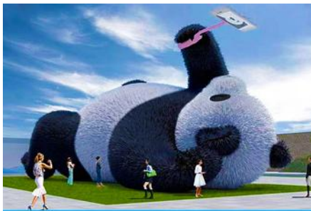
ตุ๊กตาแพนด้าอนเซลฟี

พักที่ MAOXIAN INTER HOTEL โรงแรมระดับ 4 ดาวหรือเทียบเท่าในเมืองเม่าเซียน