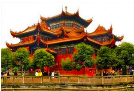
วัดเจาเจี๋ย