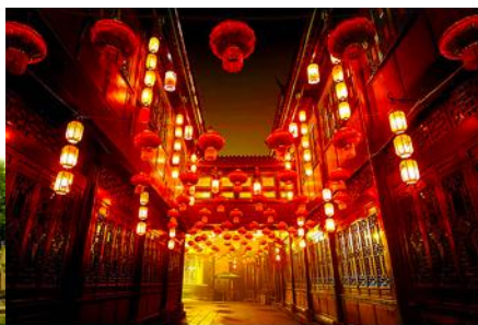
ถนนโบราณสถานจิ้งหลี่