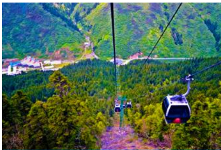
นั่งกระเช้าขึ้นสู่อุทยานหวงหลง

พักที่ JIUYUAN HOTEL ระดับ 4 ดาวท้องถิ่นหรือเทียบเท่าในอุทยานจิวจ้ายโกว