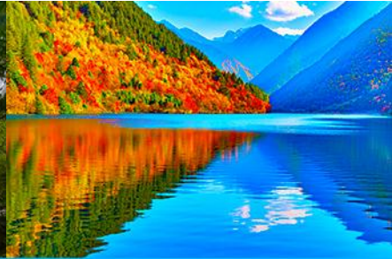
ทะเลสาบแพนด้า