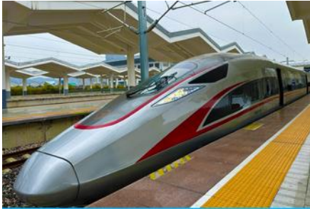
นิ่วรถไฟความเร็วสูง

พักที่ HOLIDAY INN EXPRESS HOTEL โรงแรมระดับ 4 ดาวท้องถิ่น หรือเทียบเท่าใกล้สนามบินเฉิงตู