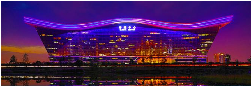
Chengdu new century global center

นำท่านเที่ยวชม ถนนโบราณ จิ้นหลี่ 成都锦里古街 ถนนสายนี้มีความยาวราว 550 เมตร มีการออกแบบอาคารและตกแต่งสถานที่เลียนแบบบ้านเรือนโบราณยุคปลายราชวงศ์หมิงและต้นราชวงศ์ชิง ผสมกับวัฒนธรรมยุคสามก๊ก เพื่อสะท้อนความเป็นเอกลักษณ์ของเมืองเฉิงตู ภายในมีจุดเช็คอินถ่ายภาพเก๋ ๆ และร้านกาแฟ ร้านอาหาร ร้านจำหน่ายของที่ระลึก โสมสเดย์มากมาย เป็นแหล่งท่องเที่ยวที่สะท้อนวัฒนธรรมของเมืองอย่างมีเอกลักษณ์ของเฉิงตู..