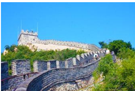
กำแพงเมืองจีนด่านจวิยงกวน

พักที่ HOLIDAY INN EXPRESS HTL OR ROYARD HTL 4* หรือโรงแรมในระดับเดียวกันในเมืองปักกิ่ง