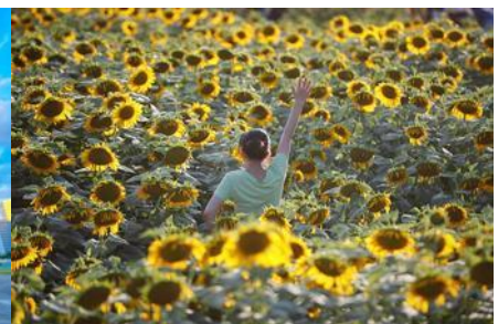
ดอกทานตะวันในสวนโอลิมปิก

วันที่สาม กรุงปักกิ่ง - กำแพงเมืองจีนด่านจวิยงกวน – ศูนย์จำหน่ายหยก-สนามกีฬา รั้งนก(ชมด้านนอก) - ชมดอกทานตะวัน ในสวน โอลิมปิก