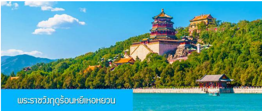
พระราชวังฤดูร้อนหยี่เหอหยวน

อิสระอาหารค่ำ ให้มีท่านมีเวลาเต็มที่ในการเดินเล่น และเปิดโอกาสให้ท่านได้ชิมลิ้มรสอาหารพื้นเมือง พักที่ HOLIDAY INN EXPRESS HTL OR ROYARD HTL 4* หรือโรงแรมในระดับเดียวกันในเมืองปักกิ่ง