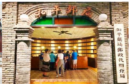
เมืองโบราณจำลอง