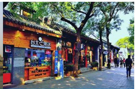
ชอยหนานหลัวกู่เซียง