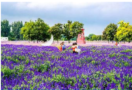
ทุ่งดอกลาเวนเดอร์

พักที่ HOLIDAY INN EXPRESS HTL OR ROYARD HTL 4* หรือโรงแรมในระดับเดียวกันในเมืองปักกิ่ง