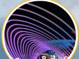
เมืองสุด้าเซินเจิ้น