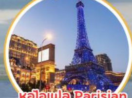
ทิวทัศน์ Parisian