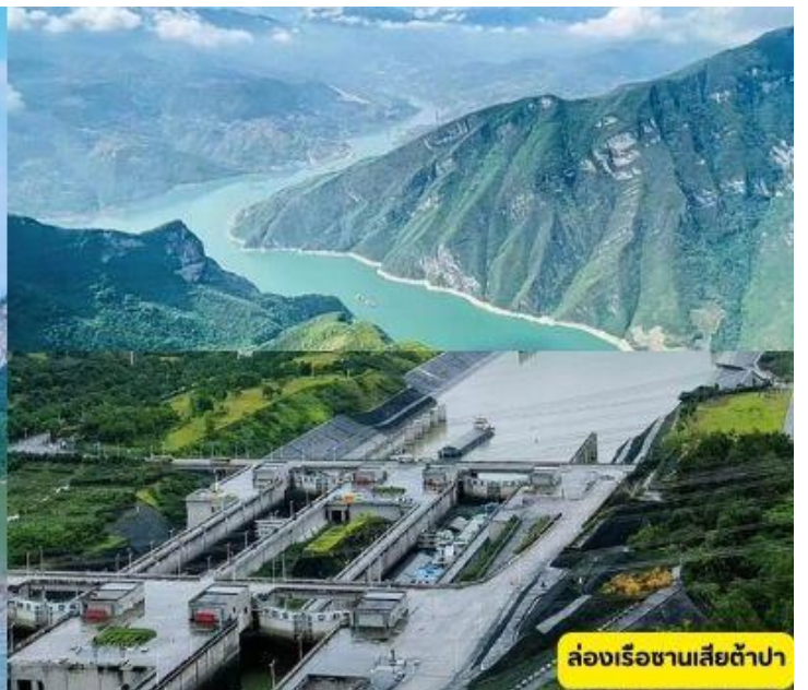
ล่องเรือซานเสีต้าป้า

เช้า 🍷 รับประทานอาหารเช้า ณ ห้องอาหารโรงแรม