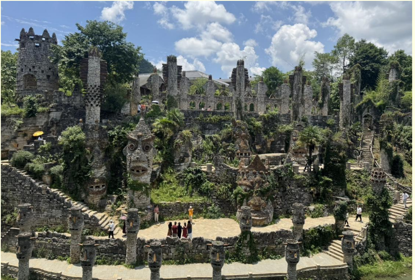
วิญญานที่ชั่วร้ายออกไป

นำท่านไป ปราสาทหินเย่หลางกู่ ในหมู่บ้านเล่อผิง ย่านหัวซี้ มณฑลกุ้ยหยาง เป็นปราสาทหินที่มี รูปปั้นหินมากกว่า 300 รูปวางเรียงรายอยู่รอบสองฝั่งของลำธารรูปปั้นเหล่านี้ดูคล้ายกับรูปปั้น มนุษย์ขนาดใหญ่บนเกาะอีสเตอร์ ในประเทศชิลี รูปปั้นเหล่านี้โดยได้รับแรงบันดาลใจมาจากจิวหนว หนว จิวจากทางตอนใต้ของจีน ที่ผู้คนจะดำเนินการแสดงโดยสวมใส่หน้ากากและเต้นรำ เพื่อขับไล่