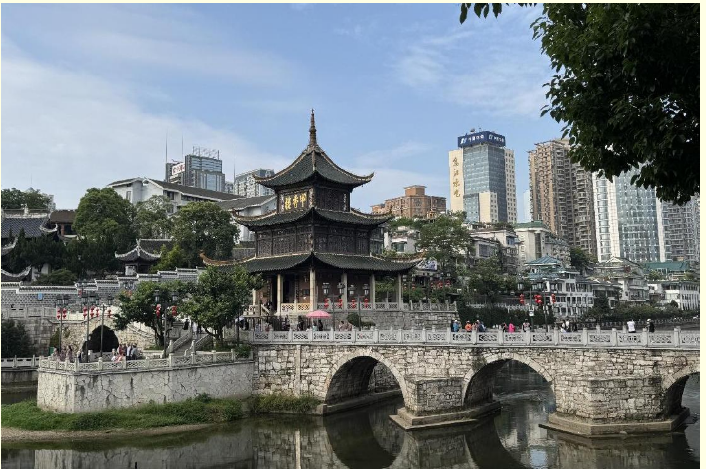
ศิลปวัฒนธรรมสำคัญแห่งชาติ

จากนั้นนำท่านสู่ หอเจี้ยวเซียวโหลว สถานที่ท่องเที่ยวระดับ 3A ของประเทศจีน ถูกสร้างขึ้นในสมัยราชวงศ์หมิง เจี้ยวเซียวโหลวที่เห็นกันอยู่ในปัจจุบันเป็นหอที่สร้างขึ้นใหม่ในปีจักรพรรดิซวนถ่ง (ผู่อี๋) ค.ศ.1909 จากพื้นสะพานจนถึงยอดหลังคาหอ มีความสูงประมาณ 20 เมตร หอมีทั้งหมด 3 ชั้น และในปี 2006 ทางคณะรัฐมนตรีได้ประกาศให้หอเจี้ยวเซียวโหลวเป็น "สถานที่อนุรักษ์"