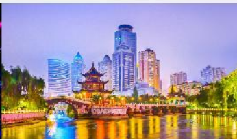
หอเจี่ยเซียวไหลว