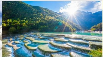
ทะเลสาบไป๋สุ่ยเหอ

*ทางบริษัทฯ ขอสงวนสิทธิ์ในการสลับโปรแกรมทัวร์ตามความเหมาะสมขึ้นอยู่กับสถานการณ์หน้างาน โดยคำนึงถึงผลประโยชน์ของลูกค้าเป็นสำคัญ