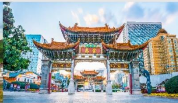
ประตูม้าทองไถ่หยก