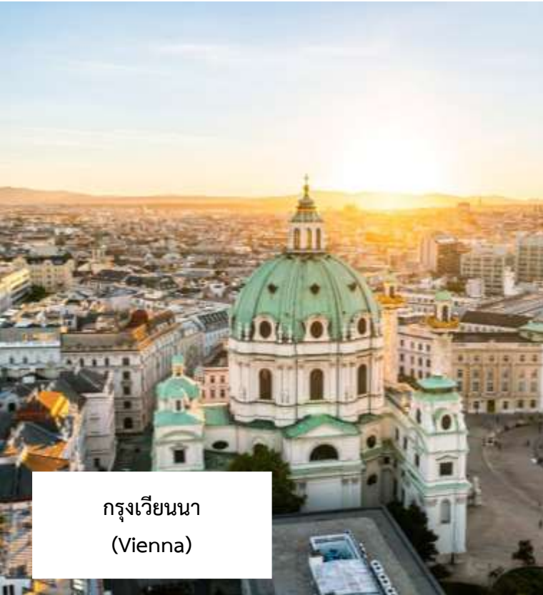
กรุงเวียนนา (Vienna)

เมนูพิเศษ!!! กุลาชชูป อาหารประจำชาติฮังการี