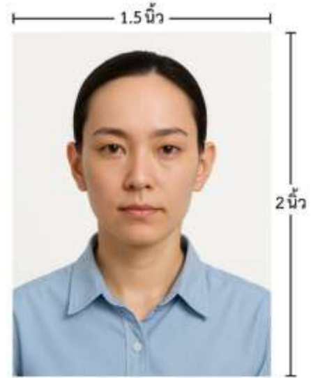
ขนาดรูปตัวอย่างใช้ยื่น Visa

*** ห้ามขีดเขียน แม็ก หรือใช้คลิปลวดหนีบกระดาษ ซึ่งอาจส่งผลให้รูปถ่ายชำรุด และไม่สามารถใช้งานได้ ***