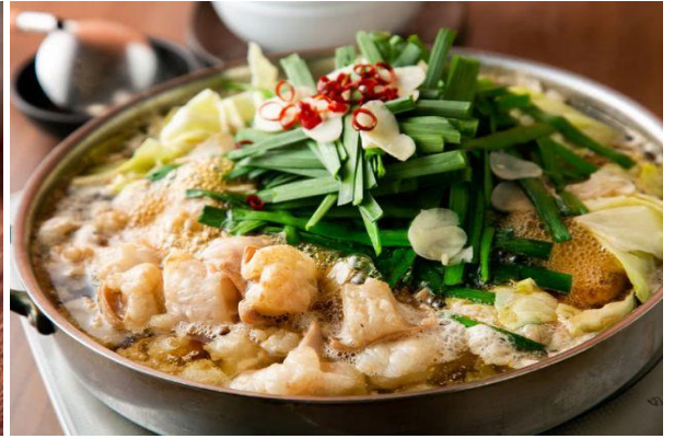
ร้านอาหารย่านยะไต (YATAI)

เย็น อิสระรับประทานอาหารค่ำตามอัธยาศัย เพื่อให้ท่านได้ช้อปปิ้งอย่างเต็มที่ (มีไกด์แนะนำ) ➡ พักค้างคืน ณ โรงแรม Nishitetsu Inn Hotel (★★★★) หรือเทียบเท่า ใจกลางย่านเทนจิน