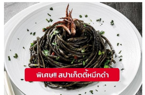
พิเศษ!! สปาเก็ตตี้หมึกดำ

Highlight ! เมื่อเยือนเกาะเวนิส เมนูที่ขึ้นชื่อและหากได้มาต้องได้ลิ้มลอง สปาเก็ตตี้ผัดซอสหมึกดำที่คลุกเคล้ากับความหอมนุ่มนวลกับบรรยากาศสุดคลาสสิคฉบับอิตาลีเลี่ยนต้นตำรับเวนิส