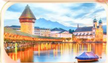
สะพานไมซ์าปเล