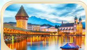
สะพานไม้อาปล