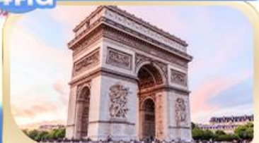
ประตูชัย