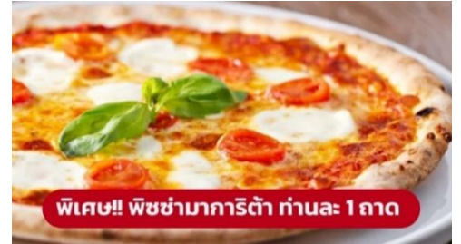
พิเศษ!! พิซซ่ามาการิต้า ท่านละ 1 ถาด

จากนั้นนำท่านเดินทางสู่ เมืองปิซ่า (Pisa) (ระยะทาง 356 ก.ม. / 5.15 ชม.) เป็นเมืองที่เป็นที่รู้จักอย่างดีเกี่ยวกับ หอเอนเมืองปิซ่า ซากโบราณวัตถุของเมืองที่ยังหลงเหลือจากศตวรรษที่5 ก่อนคริสตกาล