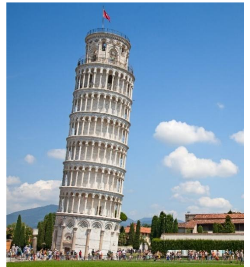
Highlight ! หอเอนปิซ่าเคยเป็นสถานที่กาลิเลโอมาพิสูจน์เรื่องแรงโน้มถ่วงของโลกและการตกของวัตถุ

นำท่านเก็บภาพความประทับใจและถ่ายรูป 1 ใน 7 สิ่งมหัศจรรย์ของโลก หอเอนปิซ่า (Leaning Tower of Pisa) หอเอนปิซ่าที่สร้างขึ้นเพื่อเป็นหอรระฆังแห่งวิหารประจำเมือง แต่เพียงการเริ่มต้นของการสร้างถึงบริเวณชั้น 3 ก็เกิดการทรุดตัวและต้องหยุดการก่อสร้างจนถัดมาอีก 100 ปี ถึงได้สร้างต่อจนเสร็จสมบูรณ์ มหาวิหารปิซ่า (Cathedral of Pisa) มหาวิหารที่สวยงามที่สุดในลักษณะโรมันเนสส์ แสดงให้เห็นจากซายหอคีลุ่ม กลางตัวมหาวิหาร และขวหอรระฆัง ตัวมหาวิหารเป็นผังกางเขน มีมุขท้ายวัดและตกแต่งซุ้มโค้งรอบวัดภายนอกเป็นแบบแถบหินอ่อน สลับสีทางขวาง ซึ่งกลายมาเป็นแบบที่เรียกว่า "ลักษณะปิซ่า" และโดมรูปไข่และ Pisa Baptisty of St. John เป็นอาคารทางศาสนาคริสต์นิกายโรมันคาทอลิก จากนั้นนำท่านเดินทางสู่ เมืองมิลาน (Milan) (ระยะทาง 282 ก.ม. / 4 ชั่วโมง)