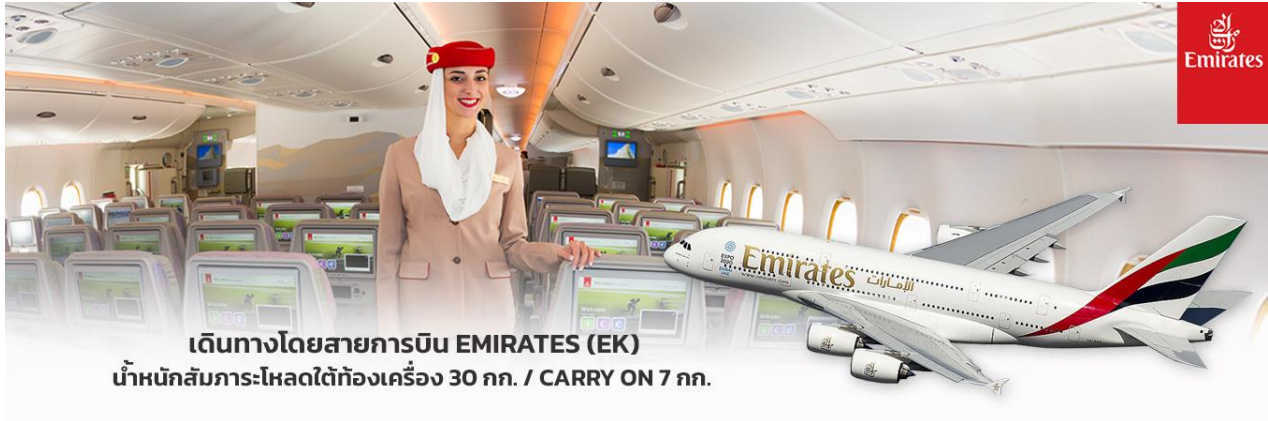
เดินทางโดยสายการบิน EMIRATES (EK) น้ำหนักสัมภาระโหลดใต้ท้องเครื่อง 30 กก. / CARRY ON 7 กก.

โทรศัพท์ : 042-246662 / 086-4515274 E-mail : journeyticket@hotmail.com