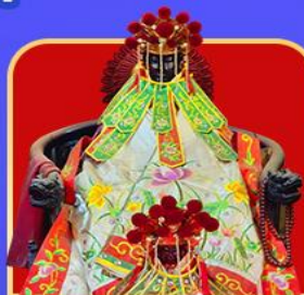
เจ้าแม่กวนอิมสองอ้า