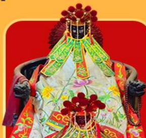
เจ้าแม่กวนอิมสองอำ