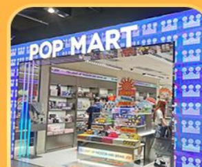
ช้อปปิ้ง POP MART