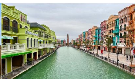
เมก้าแกรนด์เวิลด์ฮานอย