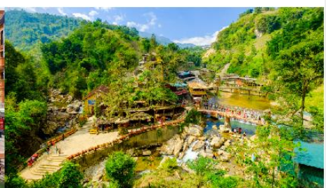
หมู่บ้านก๊อต ก๊อต

*ทางบริษัทฯ ขอสงวนสิทธิ์ในการสลับโปรแกรมทัวร์ตามความเหมาะสมขึ้นอยู่กับสถานการณ์หน้างาน โดยคำนึงถึงผลประโยชน์ของลูกค้าเป็นสำคัญ