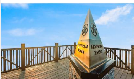
ยอดเขาฟานซิปัน