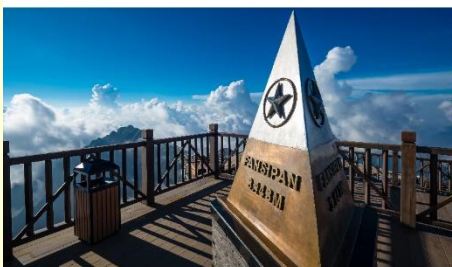
ยอดเขาฟานซิปัน