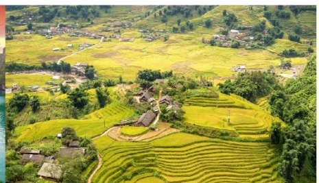
หมู่บ้านต้าฟาน