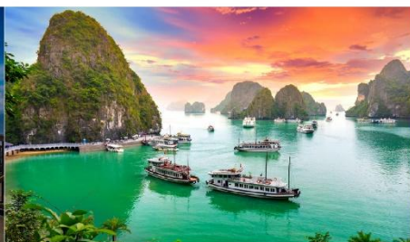
ล่องเรือชมอ่าวฮาลอง