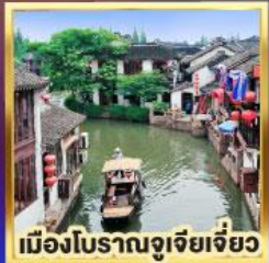
เมืองโบราณจู่เจียเจี้ยว