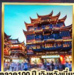
ตลาด 100 ปี เติ้งหวงเมี่ยว