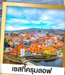
เซสทึครุมลอฟ