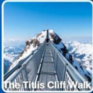
The Tittlis Cliff Walk