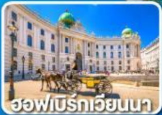
ฮอฟบิรทเวียนนา