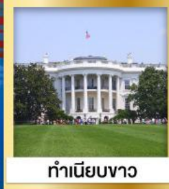
ทำเนียบขาว