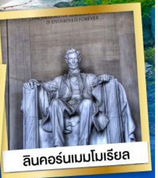
ลินคอร์นเมมโมเรียล