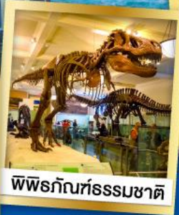
พิพิธภัณฑ์ธรรมชาติ