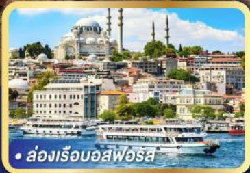
• ส่องเรือบอสฟอรัส