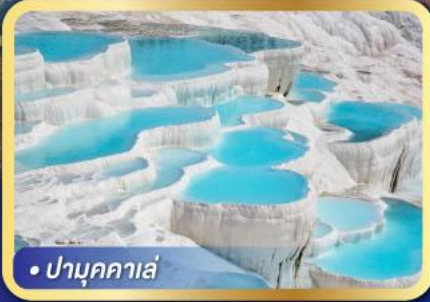
• ปามุกคาเล่