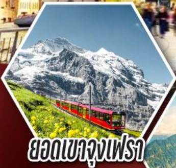
ยอชเขาจุงเฟรา