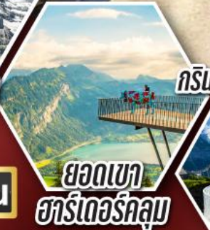
ยอชเขา ฮาร์เตอร์คูลุม