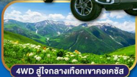
4WD สู่ใจกลางเทือกเขาคอเคซัส