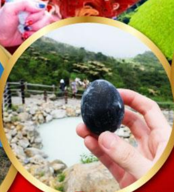
หุบเขาโอวาคูดานิ