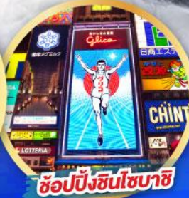
ซอปปิ้งชินโซบาชิ