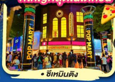
• ซีเหมินตง