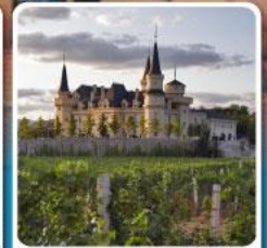
ไร่ไวน์ จุนยี่ เยียนโถ