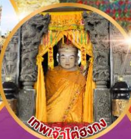
เทพเจ้าไต้ยงกง