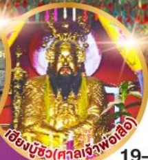
โองงบู๊ซ (ศาลเจ้าพ่อเสือ)