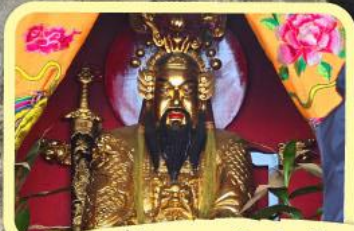
• เอียงบูซิว (ศาลเจ้าพ่อเสือ)