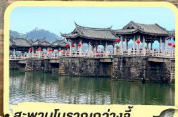
• สะพานโบราณกว้างจี้