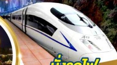
นั่งรถไฟ ความเร็วสูง