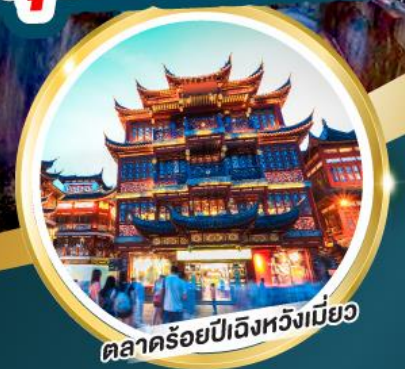
ตลาดร้อยปีเจียงหวงเมี่ยว