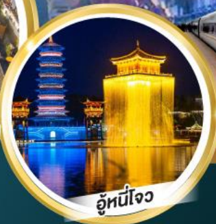
อุณหภูมิจใจ