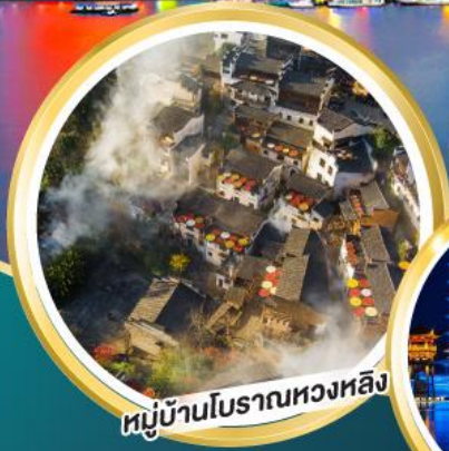
หมู่บ้านโบราณหวงหลิง